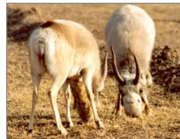
Поединок самцов сайгака. Центр по разведению в Ганьсу, Китай.

К приоритетным направлениям Центра по разведению сайгака на следующие несколько лет относятся: увеличение численности существующей группировки, проведение генетического мониторинга и изучение размножения выращенных в неволе сайгаков. Центр надеется на усиление сотрудничества с научными и природоохранными организациями для улучшения информационного обмена и усиления материально-технической базы.