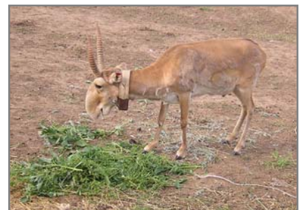
Самец сайгака с радиошейником.

Для дополнительной информации обращайтесь к директору Центра диких животных РК Ю. Н. Арылову, kalmisaigak@elista.ru