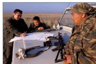
Группа инспекторов.

Подробнее на http://www.earthwire.org/kz/account.cfm