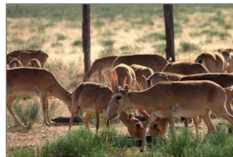
Сайгаки в вольерах питомника получают минеральные добавки, витамины и концентрированные корма перед отелом.

Для получения дополнительной информации обращайтесь к директору Центра диких животных Республики Калмыкия Ю.Н. Арылову, kalmsaigak@elista.ru