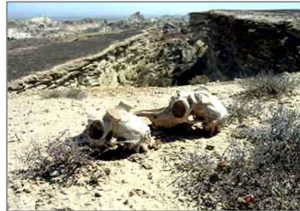
Черепы сайгаков со срубленными рогами на Восточном чинке Устьурта.

Однако проблема решаема. Россия, Казахстан – отличные тому примеры. Реализуются международные проекты, в которых принимает участие и Узбекистан. Есть люди, заинтересованные в решении проблемы. Необходимо развить этот задел, переходя от рекомендаций к их практической реализации. А для этого нужна поддержка общества и правительства. А на деле что?