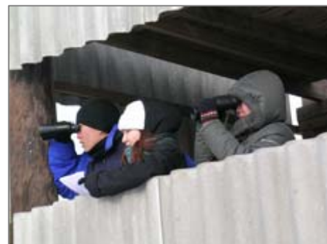
Студенты Биологического факультета Калмыцкого государственного университета проводят наблюдения за сайгаками во время гона.