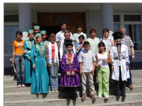
Учащиеся Яшкульской многопрофильной гимназии - друзья сайгачьего питомника.