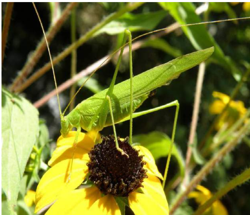
Phaneroptera falcata (Poda) – Пластинокрыл обыкновенный

Обитает на лугах, берегах водоёмов, лесных опушках. Специализированный фитофил, т.е. вид приспособлен к обитанию на растениях. Часто встречается на цветах.