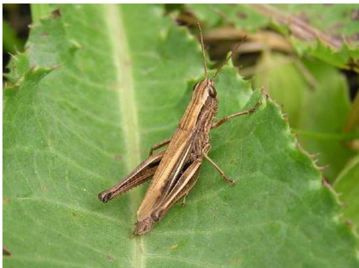
Chorthippus (s. str.) angulatus Serg. Tarbinsky – Острокрылый конек; сверху самец, внизу самка