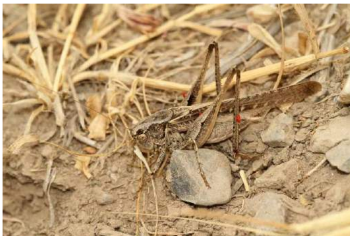
Platycleis intermedia (Audinet-Serville) – Скачок пятнистый