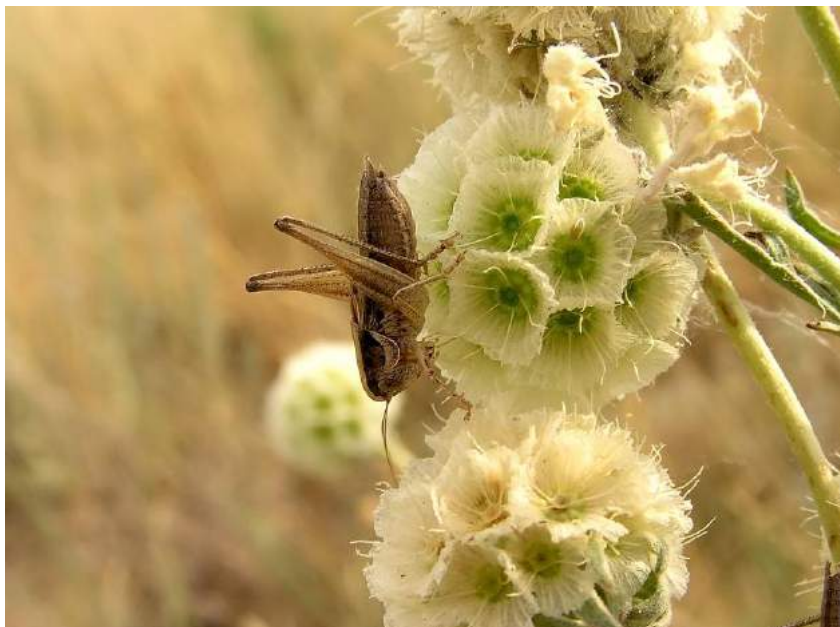
Miramiola pusilla (Miram) – Кузнечик крошечный; самец

Miramiola pusilla (Miram) – Кузнечик крошечный. Южно-степной восточноевропейско-среднеазиатско-казахстанский вид. В Казахстане обитает в степной и лесостепной зонах (Северный, Центральный и Восточный Казахстан). Держится на растениях. Встречается редко.