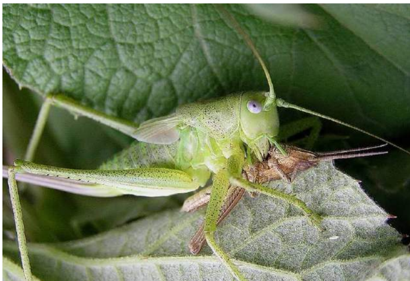
Tettigonia caudata (Charpentier); личинка поедает кобылку