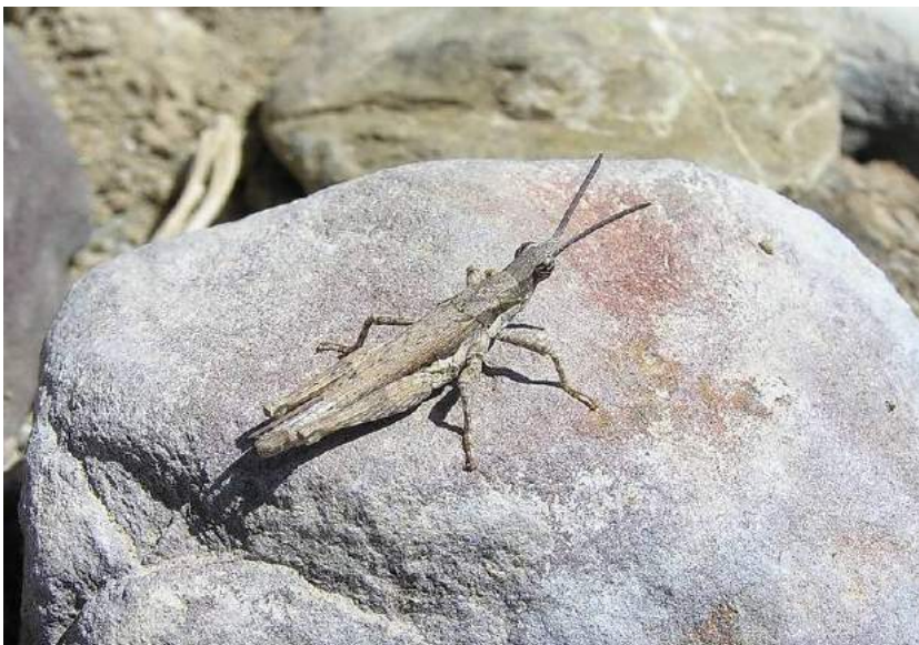
Pyrgomorpha bispinosa Walker – Пустынная остроголовка; самец