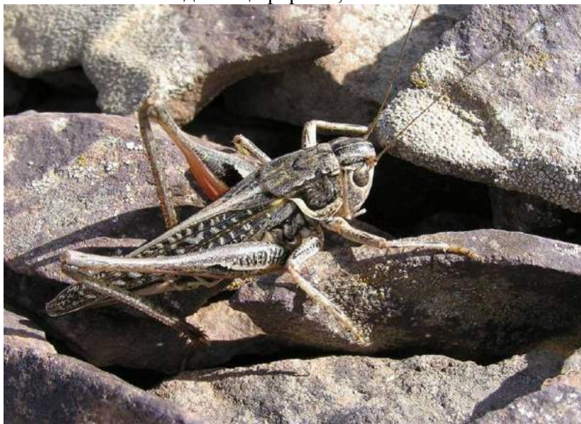
Montana dectiformis (Stshelkanovtzev) – Монтана дектициформис; самец