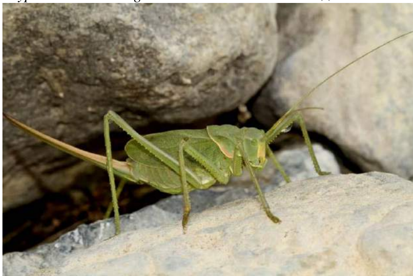
Glyphonothus alactaga Miram – Глифонотус алактага; самка