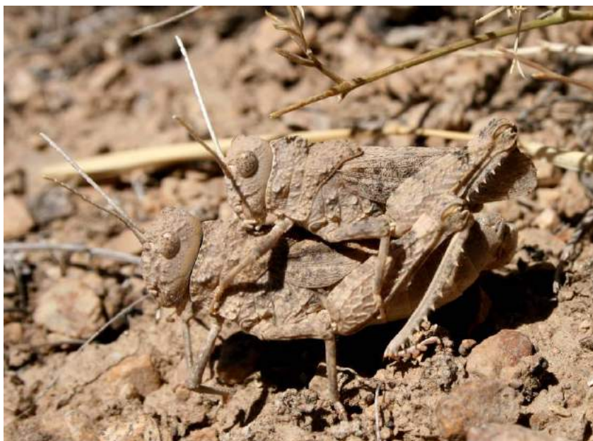
Pezotmethis karatavicus (Uvarov) – спаривание