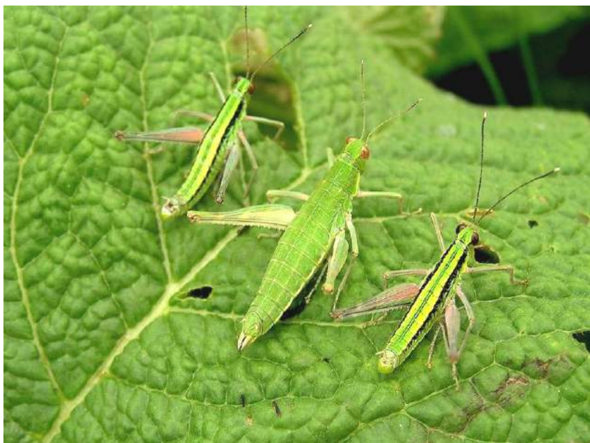
Gomphomastax clavata (Ostr.) – Ягодная бескрылая кобылка; самка (в середине) и 2 самца