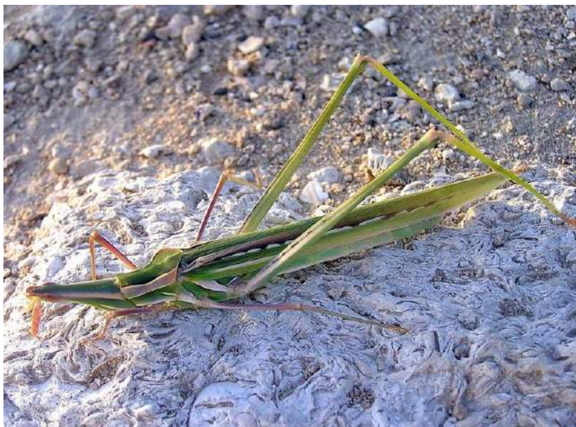
Truxalis eximia Eichwald – Изящная длинноголовка

В зависимости от местообитания встречаются в различных цветовых вариациях – зеленой, серой и соломенной. Держится на растениях (осоках и злаках).