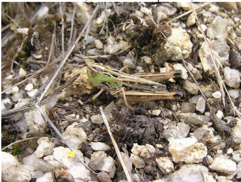
Stenobothrus (s. str.) nigromaculatus nigromaculatus (Harrich-Schaffer) – Пятнистая травянка; самка