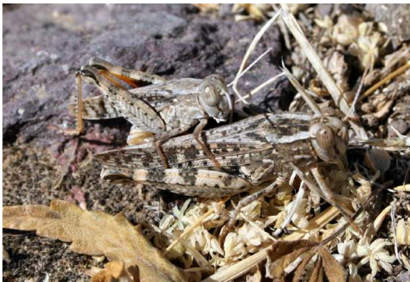
Calliptamus barbarus (Costa) – Пустынный прус; спаривание

Calliptamus coelesyriensis Giglio-Tos – Прусик ложный. Пустынно-полупустынный среднеазиатско-казахстанский вид. Встречается в Казахстане, России (Оренбургская область), Закавказье, Средней Азии, Западной Азии до Северного Афганистана. В Казахстане иногда значительно вредит посевам различных культурных растений и пастбищам. Держится на растениях или на земле.