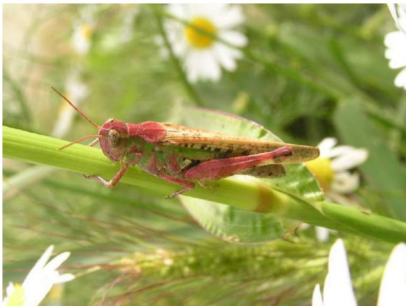
Aiolopus thalassinus (Fabricius) – Обыкновенная летунья; самка

арыков, на старых люцерниках, в садах и на пустырях. Встречается на посевах орошаемых культур.