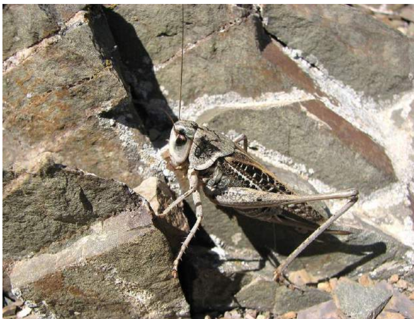
Decticus verrucivorus (Linnaeus) – Кузнечик обыкновенный, или серый

Серый кузнечик всеяден и склонен к каннибализму. Самка откладывает в землю в среднем около 50 яиц через неделю после спаривания.