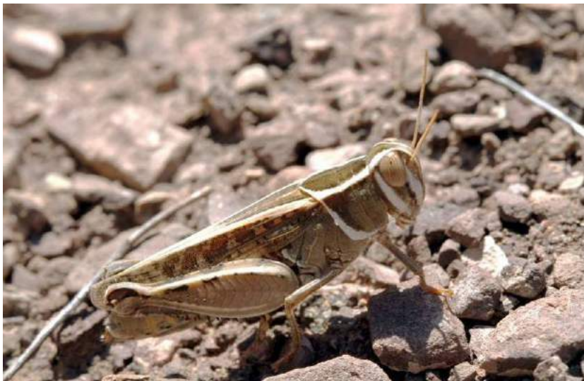
Calliptamus italicus (Linnaeus) – итальянский прус, или итальянская саранча; самка

Итальянского пруса легко отличить от других видов рода Calliptamus по окраске внутренней стороны бедер, которые с розовой или красноватой внутренней стороной и обычно с двумя неполными черноватыми перевязями, иногда очень слабыми. Верх задних голеней розовый или красный.