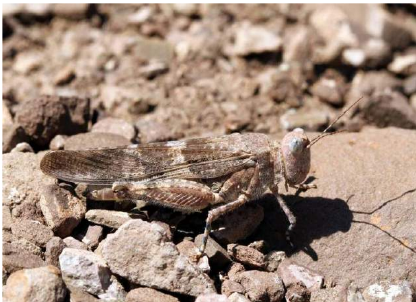
Sphingonotus nebulosus (Fischer-Waldheim) – Скальная пустынноца; самка; коричневая вариация

низменных и предгорных частях Средней Азии, включая Ферганскую долину.