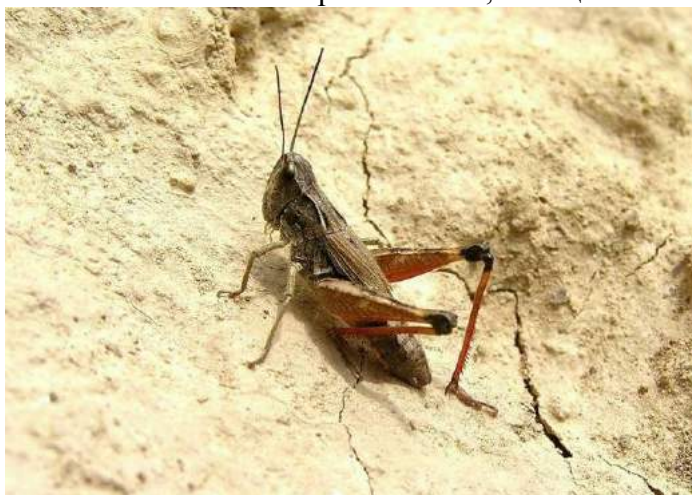
Chorthippus (s. str.) jacobsoni (Иконников) – Конек Яacobсона; самка