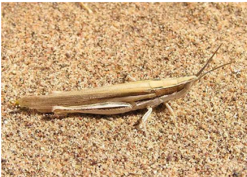
Ochridia hebetata (Uvarov) – Песчаная остроголовка

Специализированный вид, приспособленный к обитанию в песчаных пустынях и полупустынях.