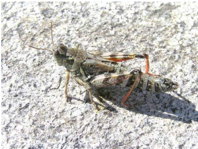
Melanoplus frigidus frigidus (Boheman) – Полярная кобылка

Ognevia longipennis (Shiraki) - Древесная кобылка. Лесной вид. Распространен в Восточном Казахстане (пойма р. Бухтарма), на юге Сибири от Алтая до Курил, в Северной Монголии, Северо-Восточном Китае, Корее и Японии. Вредит различным бобовым, а также древесной и кустарниковой растительности в Сибири и в Японии. Часто встречается в кронах деревьев.