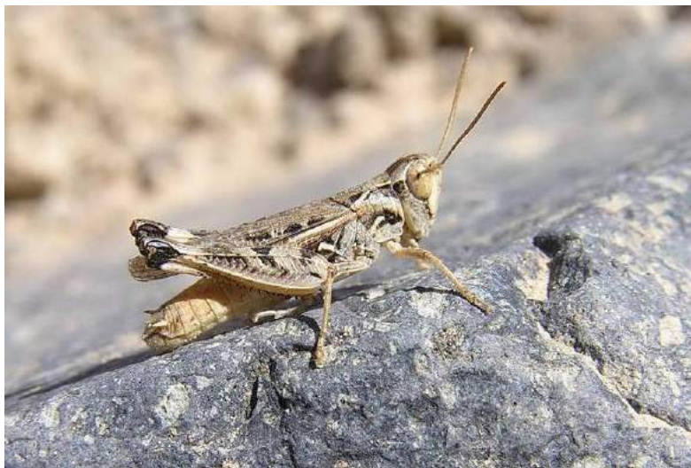
Dociostaurus (s. str.) tartarus Stshelkanovtzev – Пустынная крестовичка