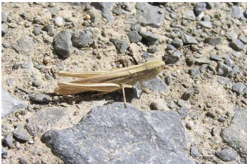
Euchorthippus pulvinatus pulvinatus (Fischer-Waldheim) – Степной конек

Euchorthippus pulvinatus pulvinatus (Fischer-Waldheim) - Степной конек. Обитатель степей и полупустынь Казахстана, юга европейской части России, юго-востока Западной Сибири, Северного Кавказа, Средней Азии, Западной Европы и Малой Азии. Живет и питается на злаках.