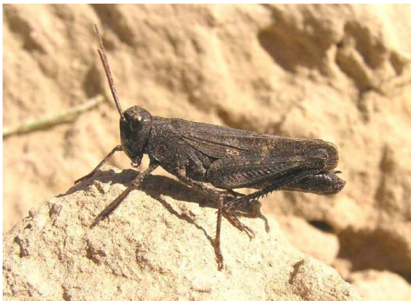
Celes variabilis variabilis (Pallas) – Изменчивая кобылка

Celes variabilis variabilis (Pallas) - Изменчивая кобылка. Распространена в Южном, Юго-Восточном, Центральном, Северном и Восточном Казахстане, европейской части России (вся лесная и лесостепная зона), на юге Западной Сибири, в Средней Азии (кроме равнинной части). Характерна для типичных степей. Питается многими видами растений. Держится на траве или на поверхности почвы.