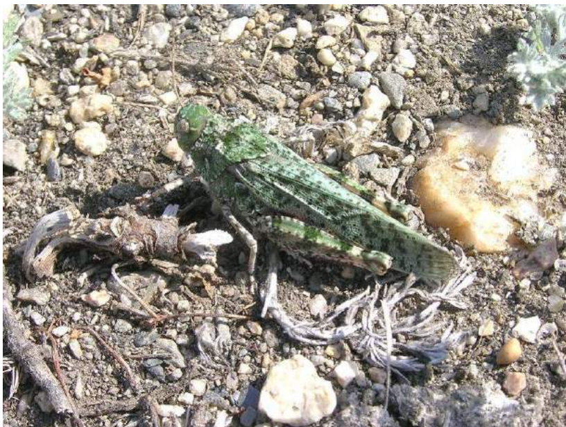
Angaracris barabensis (Pallas) – Барабинская, или красноногая трещотка

Angaracris barabensis (Pallas) – Барабинская, или красноногая трещотка. Южно-степной казахстанско-монгольский вид с оптимумом ареала в степной зоне. Северный и Центральный Казахстан: Костанайская, Павлодарская обл., Прииртышские степи, горы Кент, Карсакпайское плато. – Россия: юг Сибири до Приамурья; Монголия; Северный Китай. Повреждает растительность пастбищ. Питается преимущественно кохиями, а также караганами. Эремобионт.