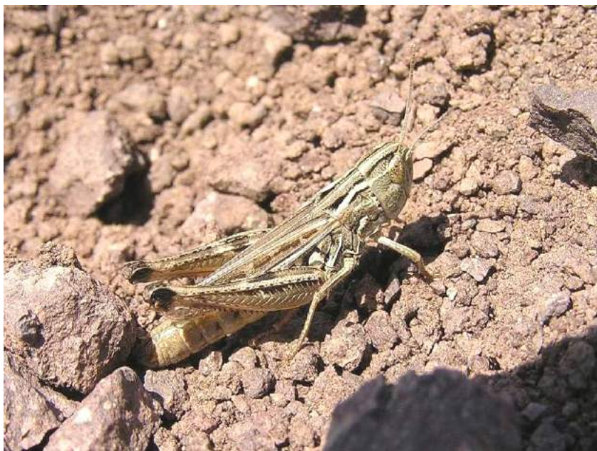
Stenobothrus (Stenobothrodes) eurasius Zubovsky – Евразийская травянка; самка

Stenobothrus (Stenobothrodes) eurasius Zubovsky - Евразийская травянка. Вид разделяется на 5 подвидов, 2 из которых встречаются в Казахстане. S. (Stenobothrodes) eurasius eurasius Zubovsky. Распространен в Казахстане, на юге Сибири (на восток до Забайкалья), в горах Кыргызстана. Вредит хлебным злакам и лугам в горах Кыргызстана. S. (Stenobothrodes) eurasius hyalosuperficies Vorontsovsky распространен в Западном, Северном, Северо-Западном и Центральном Казахстане, на юге европейской части России и юге Украины. Питается различными злаками, на которых и живет.