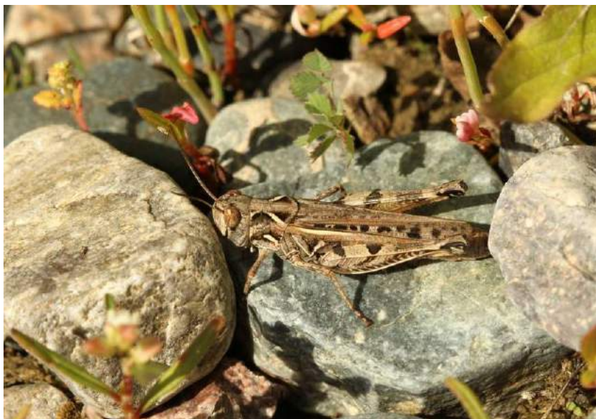
Dociostaurus (s. str.) brevicollis brevicollis (Eversmann) – Малая крестовичка; самка

Dociostaurus (s. str.) brevicollis brevicollis (Eversmann) - Малая крестовичка. Степной европейско-восточносибирский вид. Встречается в Западном, Северном, Центральном, Юго-Восточном и Восточном Казахстане. Второстепенный вредитель хлебных злаков, а также сенокосных угодий.