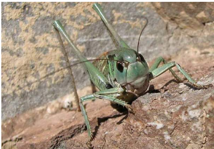
Decticus verrucivorus (Linnaeus) – Кузнечик обыкновенный, или серый; зеленая вариация