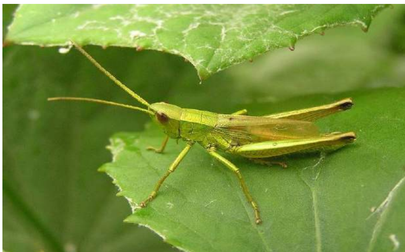
Chrysochraon dispar (Germar) – Непарный зеленчук; самец