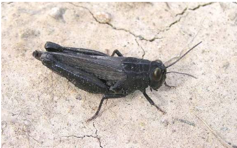
Calliptamus coelesyriensis Giglio-Tos – Среднеазиатский ложный прусик; черная вариация

Calliptamus italicus (Linnaeus) – итальянский, или оазисный прус, итальянская саранча. Западнопалеарктический южный вид. Разделяется на 2 подвида. В Казахстане наиболее обычен C. italicus italicus (Linnaeus) . Один из главных вредителей многих культурных и диких растений. Представлен двумя фазами - стадной и одиночной. При миграционных перелетах стаи саранчи могут залетать на 100-150 км от очагов массового размножения. Его экологическое распределение подчиняется принципу зональной смены местообитаний. На юге лесной зоны он поселяется на меловых обнажениях с разреженным покровом, а в Средней Азии - в долинах рек, оазисах и предгорьях, почему его здесь называют оазисным прусом. Из диких растений излюбленными для оазисного пруса являются верблюжья колючка, солодка, лебеда разнолистная, песчаная мимоза, вьюнок полевой, парнолистник обыкновенный, портулак и др. При наличии двудольных растений прусы стараются избегать питаться однодольными. Из культурных растений личинки и