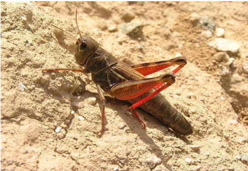
Arcyptera microptera (Fischer-Waldheim) – Крестовая кобылка; самка