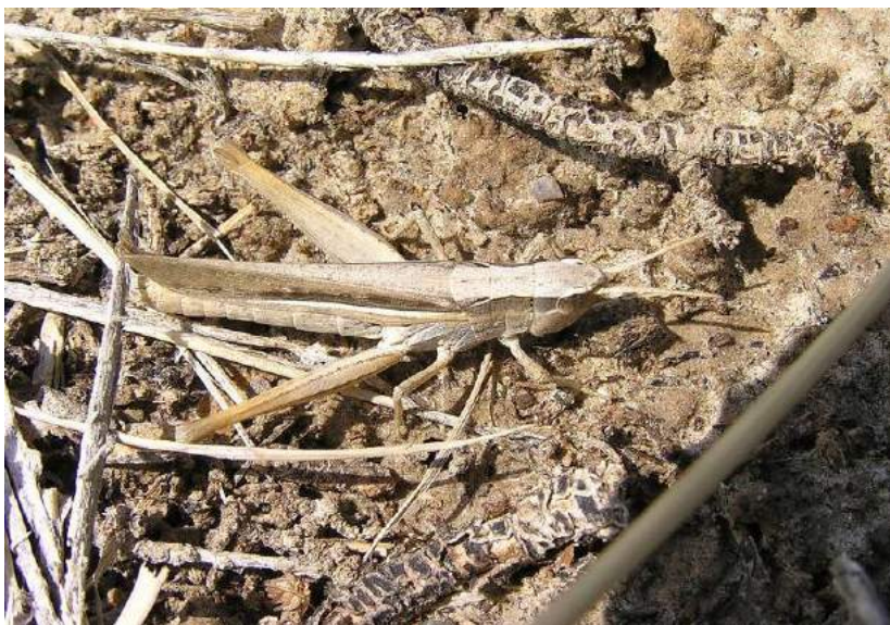
Duroniella kalmyka (Adelung) - Калмыцкая толстоголовка

Chrysochraon dispar (Germar) - Непарный зеленчук. Полизональный транспалеарктический вид. Разделяется на ряд подвидов. Распространен по всей территории Казахстана. Свое название получил из-за резкого полового диморфизма, что хорошо видно на фото.