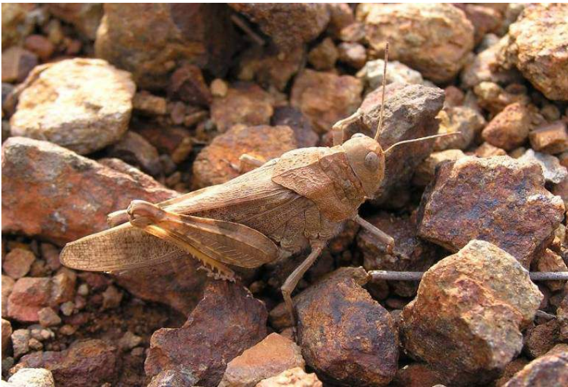
Bryodemella tuberculata (Fabricius) – Ширококрылая, или бугорчатая трещотка