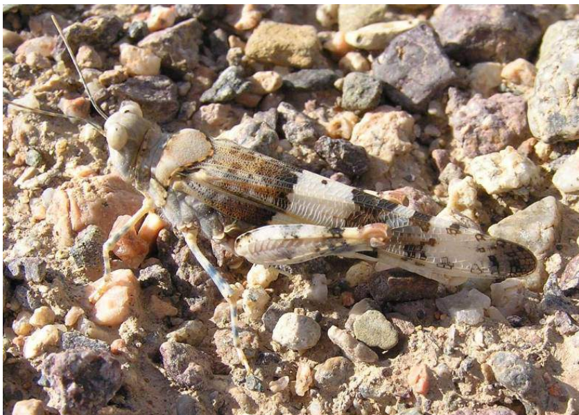
Pseudosphingonotus savignyi (Saussure) – Песчаная пустынноца на каменистом грунте