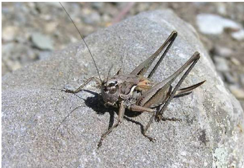
Montana dectiformis (Stshelkanovtzev) – Монтана дектициформис; самка