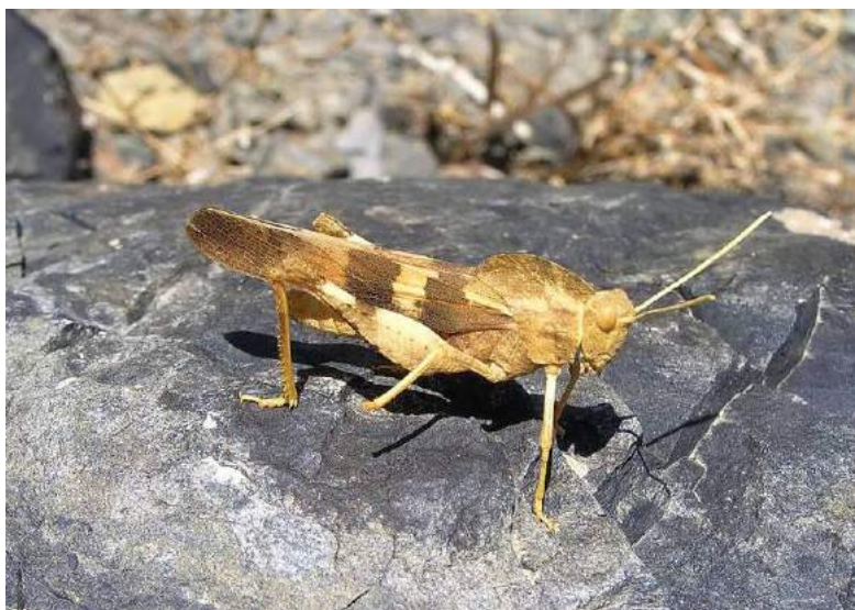
Pyrgodera armata Fischer-Waldheim – Гребневка; желтая вариация