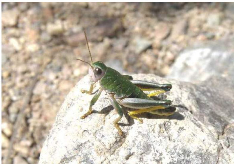
Conophyma almasyi (Kuthy) – Конофима Альмаши

Conophyma nanum Mistshenko. Вид распространен в Юго-Восточном Казахстане (Заилийский Алатау, Кунгей Алатау, Джунгарский Алатау) и Кыргызстане (Киргизский хр.). Обитает на высоте 1100-3200 м. Держится на травянистых растениях, которыми питается.