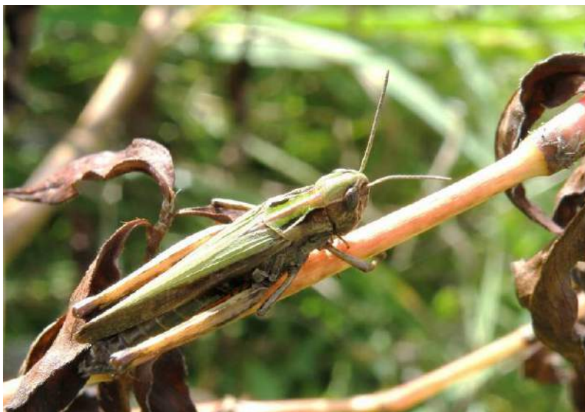
Omocestus viridulus (Linnaeus) – Зеленая травянка; самка

Omocestus haemorrhoidalis haemorrhoidalis (Charpentier) - Краснобрюхая травянка. Полизональный трансевразийский вид. Предпочитает степные злаковые биотопы. Распространен в Казахстане, европейской части России (кроме крайнего севера), Сибири, на юге Дальнего Востока, в Средней Азии, на Кавказе, в Европе, Малой Азии, Монголии и Корее. Питается различными злаками.