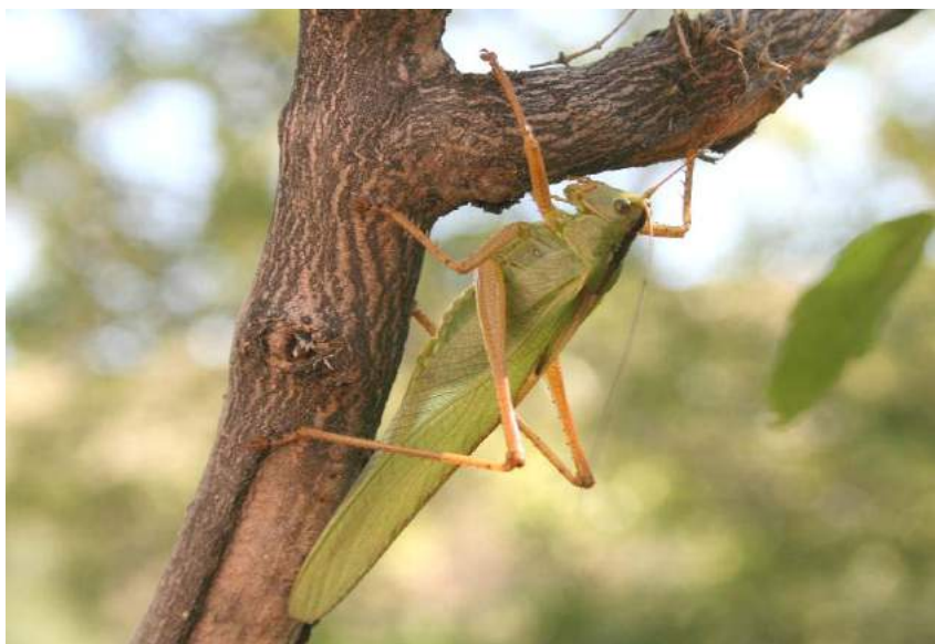
Tettigonia viridissima L. – Кузнечик зеленый; самка