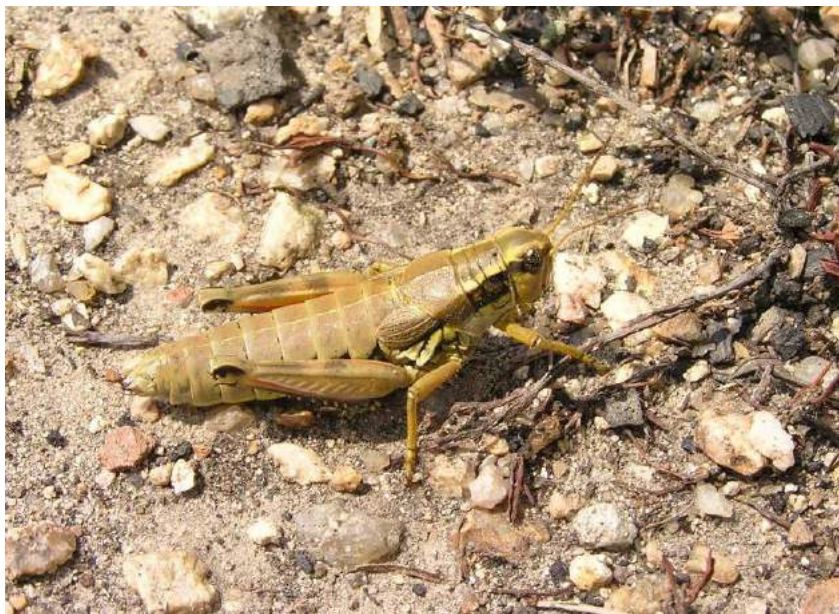
Podisma pedestris pedestris (Linnaeus) – Бескрылая кобылка

Melanoplus frigidus frigidus (Boheman) – Полярная кобылка. Лесной голарктический вид. Распространен в Канаде и по всей лесной зоне Евразии – на восток до Тихого океана (на юге обитает в горах). В Казахстане встречается на востоке – на горных хребтах Алтая.