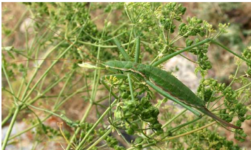
Saga pedo (Pallas) – Дыбка степная

Tessellana vittata (Charpentier) – Скачок полосатый. Южно-степной вид. Распространен в Западной Европе, на юге европейской части России, в Казахстане, Кыргызстане, на юге Сибири, Кавказе, в Таджикистане и Иране. В Казахстане встречается повсеместно, как на равнине, так и в горах. Держится на растениях.