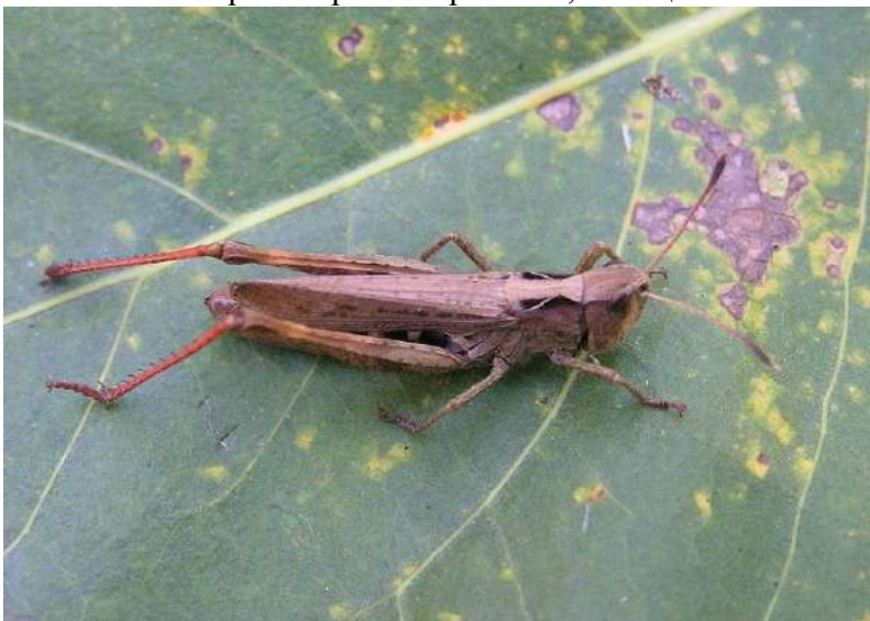
Myrmeleotettix maculatus maculatus (Thunberg) – Пятнистая копьеуска; самка