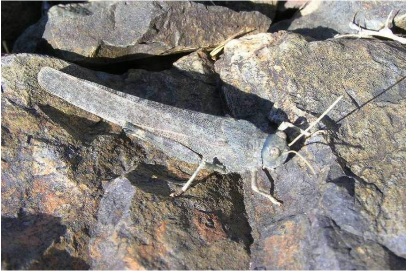
Bryodema heptapotamicum Вей-Вьенко – Семиреченская трещотка