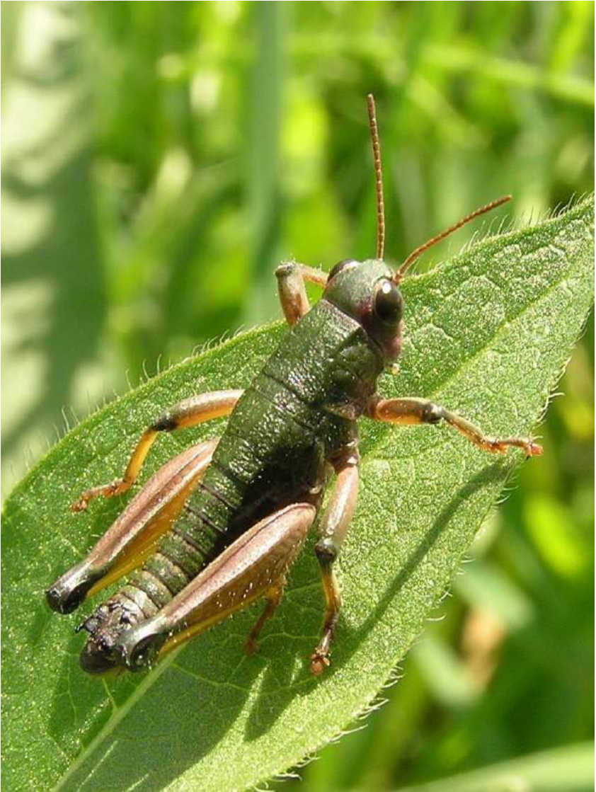
Conophyma semenovi semenovi Zubovsky