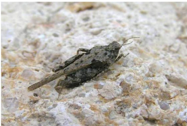
Tetrix bolivari Sauly – Прыгунчик Боливара

Tetrix bolivari Sauly – Прыгунчик Боливара. Широко распространенный евразийский вид. Обитает преимущественно по берегам различных водоемов. Питается разлагающимися органическими остатками и мхами.