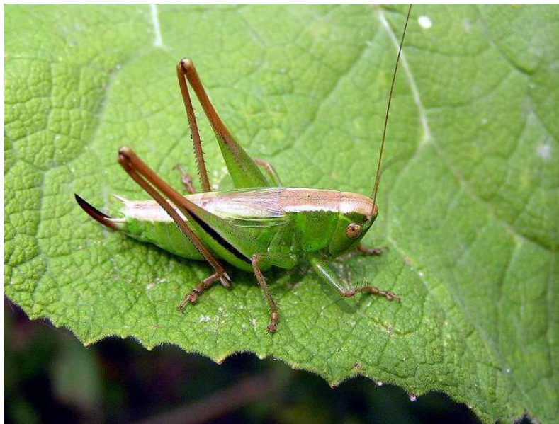
Bicolorana bicolor (Philippi) – Скачок двуцветный

Северостепной трансевразийский вид. В степной зоне обычен, в лиственно-лесной зоне обитает на лугах.