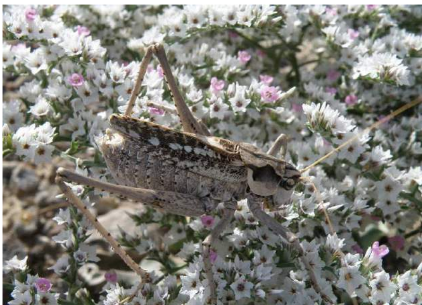
Caereocercus fuscipennis Uvarov – Кузнечик темнокрылый