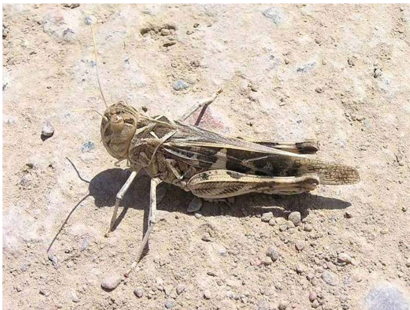
Oedaleus decorus (Germar) – Чернополосая кобылка

Oedaleus decorus (Germar) – Чернополосая кобылка. Степной транспалеарктический вид. Распространен в Казахстане, степях европейской части России, на юге Западной Сибири, Украины, по всей Средней Азии, на Кавказе, юге Европы, в Северной Африке, Передней Азии, Западном Китае. Населяет сухие злаковые степи, на юге также встречается среди более богатой растительности. Наносит незначительный вред широкому кругу культурных растений, в том числе зерновым, бобовым, сахарной свекле, бахчевым и овощным культурам, посевам кормовых трав и пастбищам, а иногда также и плодовым деревьям и кустарникам и т.п. Живет на поверхности почвы под растительным покровом.