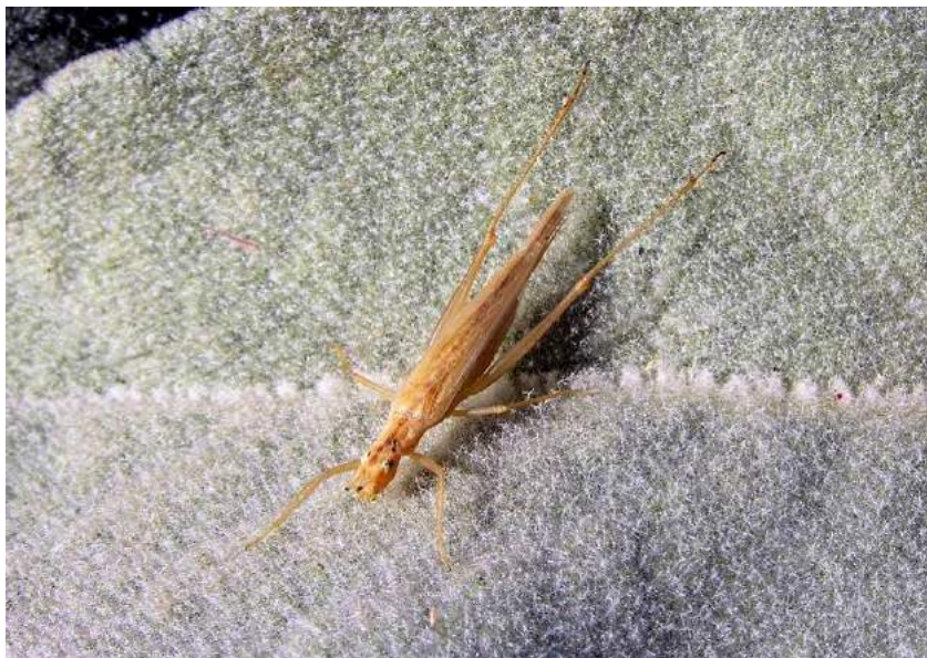
Oecanthus turanicus Uv. – Трубачик туранский