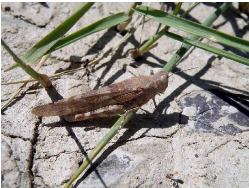
Sphingonotus rubescens (Walker) – Прибрежная пустынноца