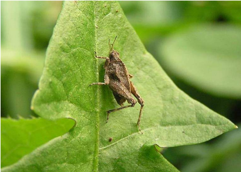
Tetrix tartara Bolivar – Прыгунчик пустынный