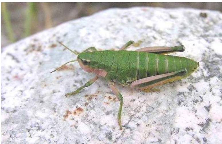
Conophyta nanum Mistshenko – Конофима нанум; самка

на опустыненные подгорные равнины. Питается различными травянистыми растениями.