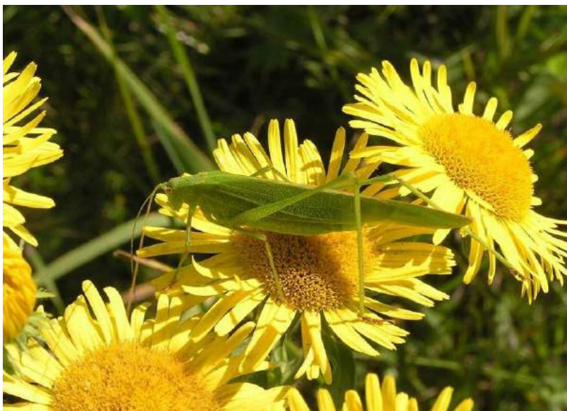
Phaneroptera falcata (Poda) – Пластинокрыл обыкновенный; вверху самка, внизу самец.