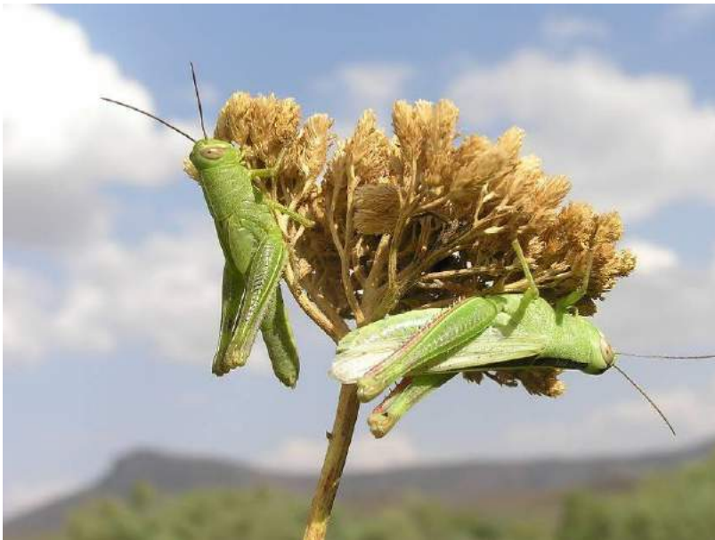
Heteracris pterosticha (Fischer-Waldheim) – Бахчевая кобылка