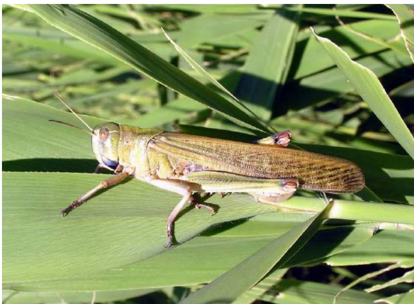
Locusta migratoria migratoria Linnaeus – Перелетная азиатская саранча; вверху самка, внизу самец