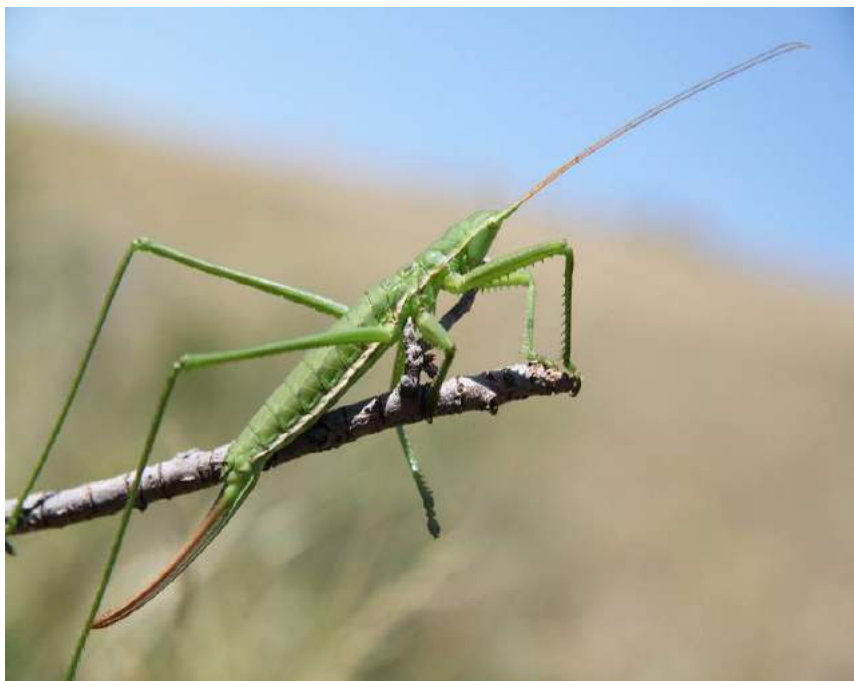
Saga pedo (Pallas) – Дыбка степная

Вид внесен в Европейский красный список, Красные книги России, Украины, Республики Казахстан. Для сохранения вида необходимо создавать микрозаповедники в районах обитания дыбки с запретом на выпас скота, сенокосение и обработки инсектицидами смежных сельскохозяйственных угодий.