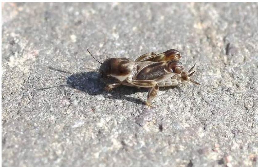
Xya variegata Latreille – обыкновенный триперст