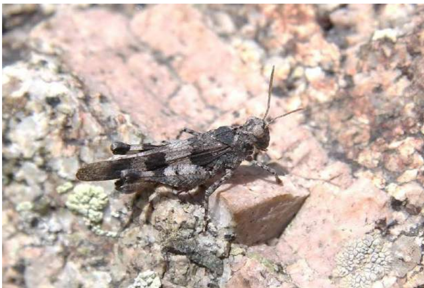
Oedipoda miniata (Pallas) – Краснокрылая кобылка; самец

некоторые сельскохозяйственные культуры. Основание крыльев красное с черной перевязью.