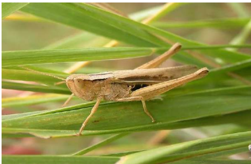
Chorthippus (s. str.) karelini (Uvarov) – Кобылка Карелина.

Афганистане, Северо-Западном Китае и Монголии. Живет на злаках. Вредит хлебным злакам и сенокосным угодьям.