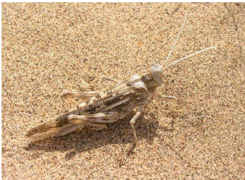
Thrinchus arenosus arenosus Bey-Bienko – Песчаный спинозуб

Thrinchus arenosus arenosus Bey-Bienko – Песчаный спинозуб. Распространен в Юго-Восточном Казахстане: в песках Восточного Прибалхашья от р. Лепсы на севере до г. Капчагая на юге и песках Муюн-кумы (Акыр-тюбе). Срединный киль на переднеспинке несет зубцы. Крылья зеленовато-голубоватые с черной перевязью. Обитатель песчаных пустынь.