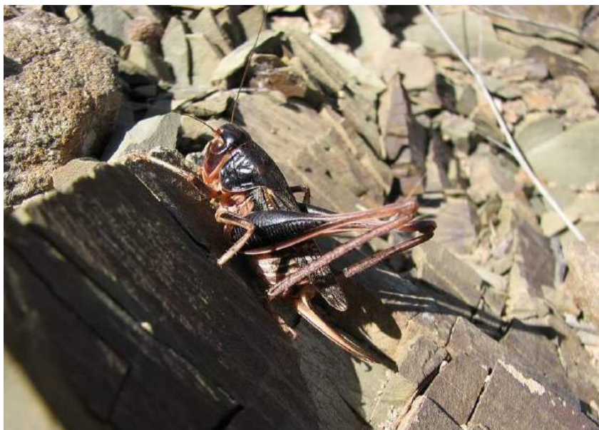
Montana sp. Самки. Хр. Каратау (Мангышлак)