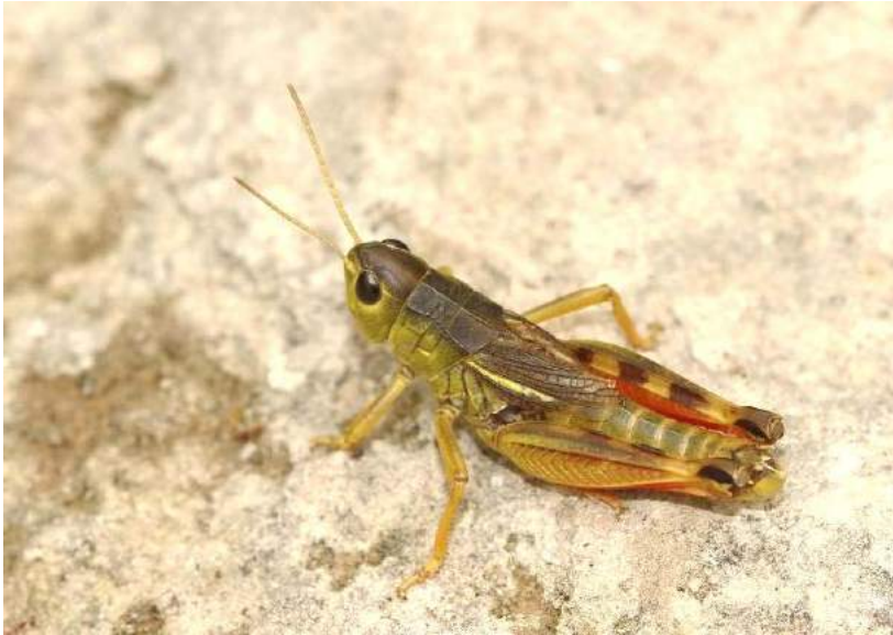
Arcyptera microptera (Fischer-Waldheim) – Крестовая кобылка; самец