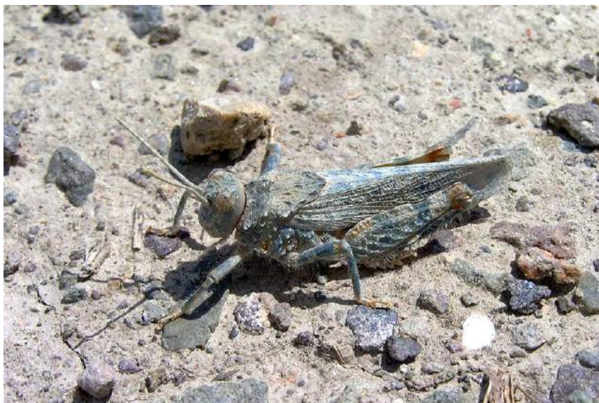
Asiotmethis heptapotamicus (Zub.) – Семиреченская степная кобылка

Pezotmethis karatavicus (Uvarov) – Пезотметис каратавский. Разделяется на 2 подвида, которые распространены по хребту Каратау. Живут на склонах с щербнисто-каменистыми почвами и пустынно-полупустынной растительностью. Самцы имеют развитые надкрылья и крылья, а самки – сильно укороченные надкрылья.