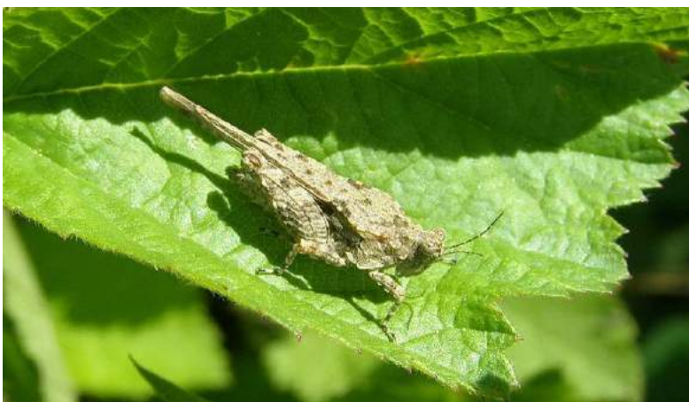
Tetrix bolivari Saulcy – Тетрикс Боливар

Tetrix tartara Bolivar – Прыгунчик пустынный. Среднеазиатско-казахстанский вид. Ареал заходит в Западный Китай. Живет во влажных местах, обычно около водоемов. Питается растительной пищей. Зимуют личинки или взрослые насекомые. Отмечены случаи незначительного повреждения листьев земляники.