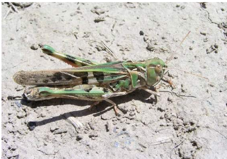
Oedaleus decorus (Germar) – Чернополосая кобылка; зеленая вариация

Pyrgodera armata Fischer-Waldheim - Гребневка. Полупустынно-пустынный вид. Распространен в Казахстане (повсеместно, кроме лесостепной части), Предкавказье, Закавказье, Среднем и Нижнем Поволжье, на равнинах Средней Азии; по всей Передней Азии до Ирана и Афганистана. Второстепенный вредитель пастбищ.