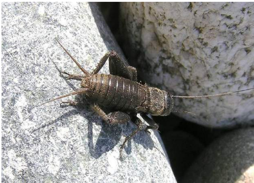
Melanogryllus desertus (Pallas) - степной сверчок; личинка