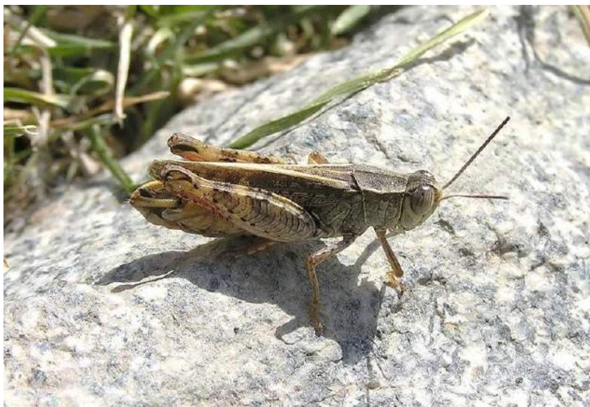
Calliptamus italicus (Linnaeus) – итальянский прус, самец

Calliptamus turanicus Serg. Tarbinsky – Богарный, или туранский прус. Пустынный среднеазиатско-казахстанский вид. Личинки и взрослые особи богарного пруса поедают многие дикие растения. Прус не только питается зелеными листьями, но и поедает лепестки цветов, генеративные органы и засохшие части растений, особенно мятлика и осоки. В жаркие часы охотно питается органическими остатками животного происхождения. Из культурных растений повреждает хлопчатник, пшеницу, ячмень и кукурузу. Один из самых вредоносных видов саранчовых на юге Казахстана.