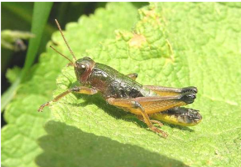
Conophyma semenovi semenovi Zubovsky – Конофима Семенова; самец.