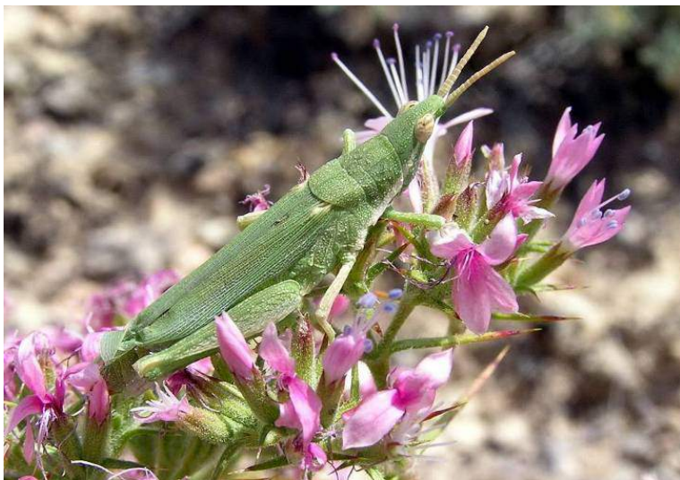
Pyrgomorpha bispinosa Walker – Пустынная остроголовка; самка, зеленая форма