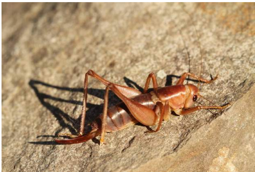
Eumetrioptera mistshenkoi Bekuzin – Эуметриоптера Мищенко