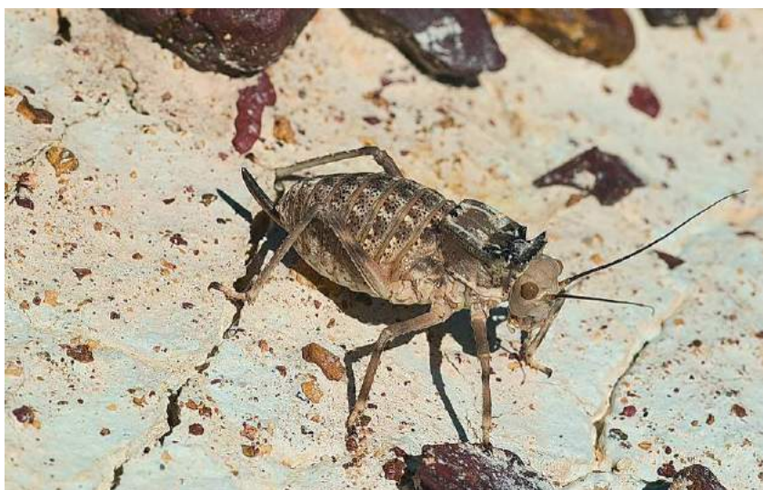
Damalacantha vacca (Fischer de Waldheim) – Кузнечик Дамалаканта вакка (фото В.Т. Якушкина)