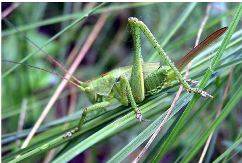
Gampsocleis glabra (Herbst) – Кузнечик оголенный; личинка