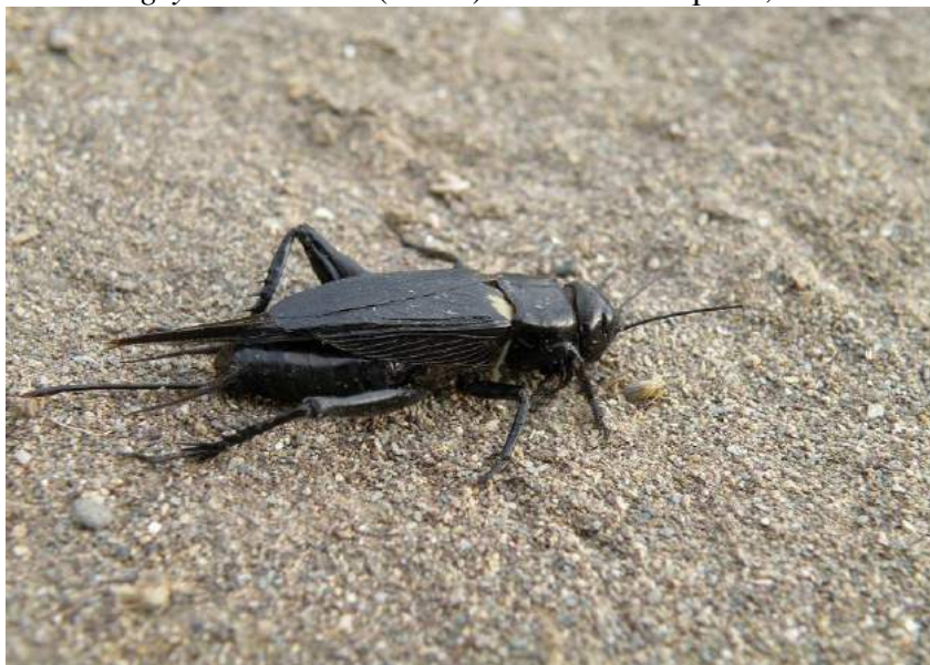
Gryllus bimaculatus De Geer – Сверчок двупятнистый; самка