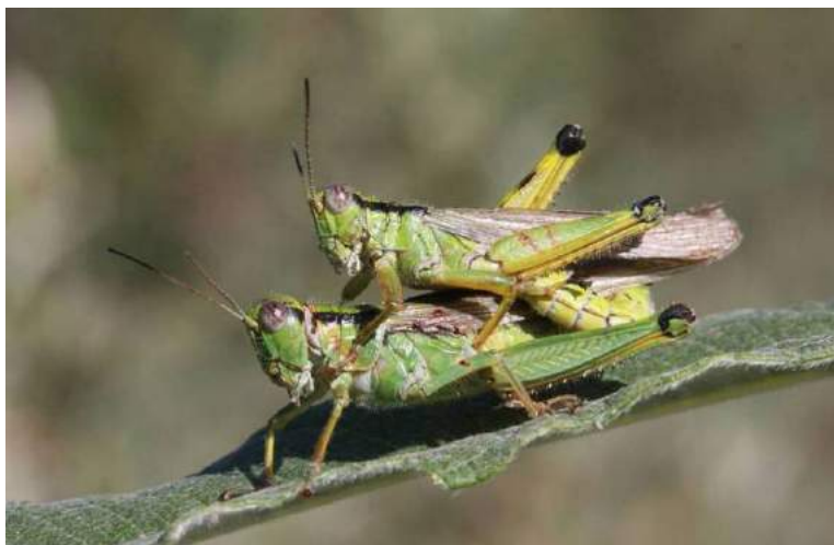
Ognevia longipennis (Shiraki) – Древесная кобылка; спаривание

яблони, винограда и шелковицы. Повреждает люцерну, хлопчатник, кукурузу, хлебные злаки, бахчевые и огородные культуры. Зимуют личинки и имаго.