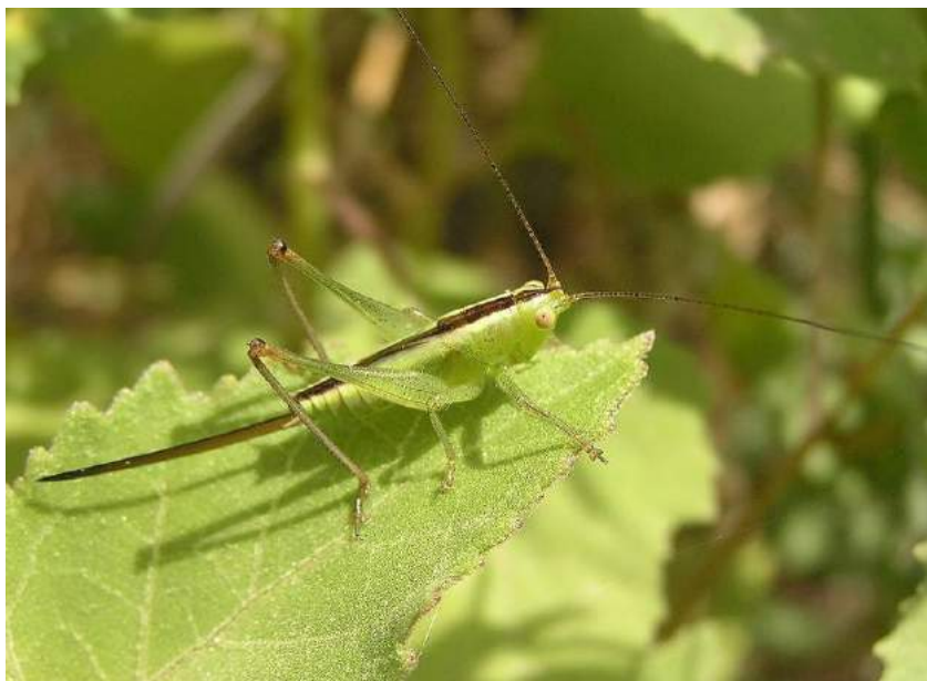
Conocephalus fuscus (Fabricius) – Мечник обыкновенный; личинка

В Казахстане встречается в степной и лесостепной зонах, а также в горах на юге и юго-востоке.