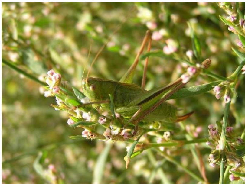
Bicolorana bicolor (Philippi) – Скачок двуцветный

Caereocercus fuscipennis Uvarov – Кузнечик темнокрылый. Пустынный среднеазиатский вид. Населяет Западный, Центральный, Южный, Юго-Восточный, Восточный Казахстан (плато Устюрт, Северный Прикаспий, Тургайская столовая страна, Нижнесырдарьинская низменность, хр. Саур, Джунгарский Алатау, Заилийский Алатау, хр. Каратау, Зайсанская котловина). Тамнобионт, т.е. обитатель кустарников.