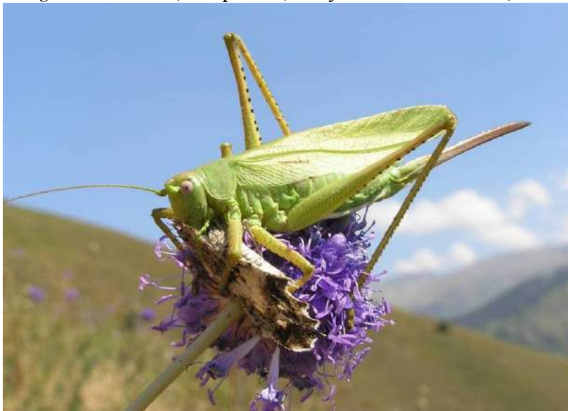
Tettigonia caudata (Charpentier) – Кузнечик хвостатый с добычей (бабочкой Chazara sp.)