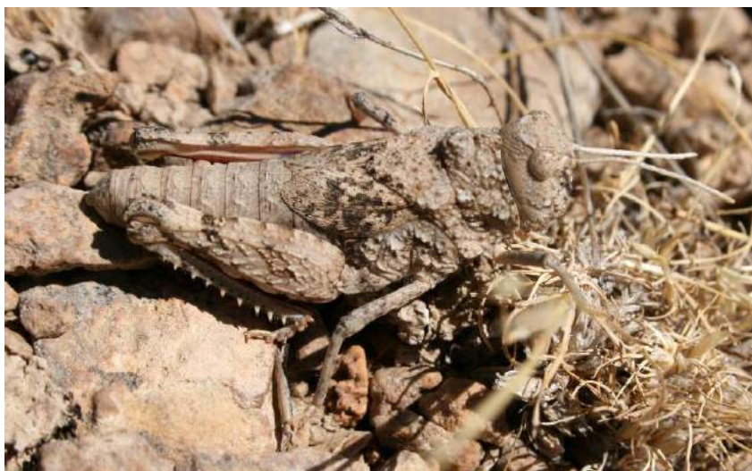
Pezotmethis karatavicus (Uvarov) - Пезотметис каратавский; самка