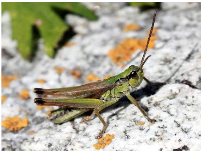
Chorthippus (s. str.) fallax fallax (Zubovsky) – Востоносибирский конек; самец

Chorthippus (s. str.) jacobsoni (Иконников) - Конек Яacobсона. Распространен в Юго-Восточном Казахстане (Заилийский Алатау) и Кыргызстане. Живет в горах.