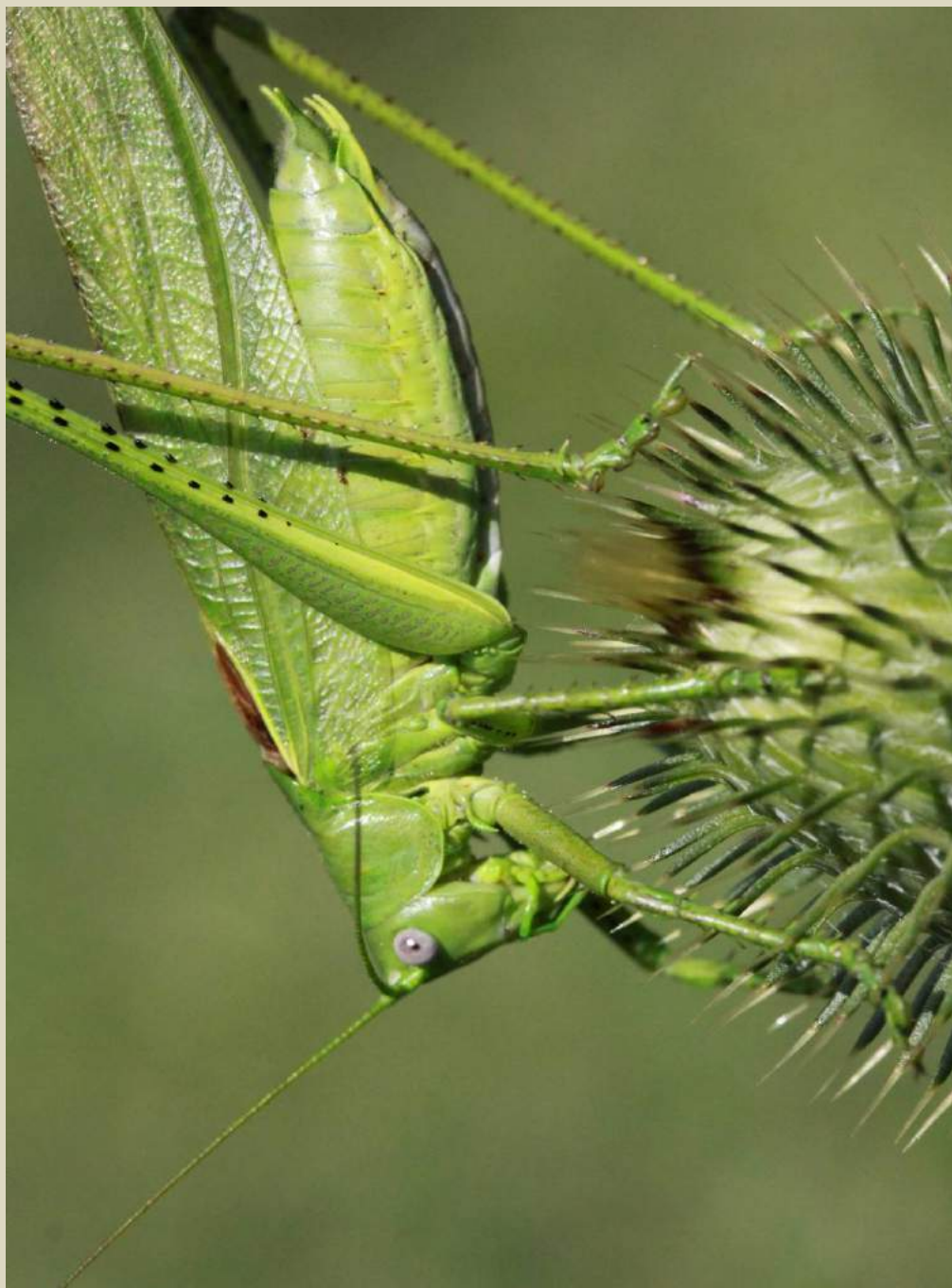
Tettigonia caudata (Charpentier) – Кузнечик хвостатый