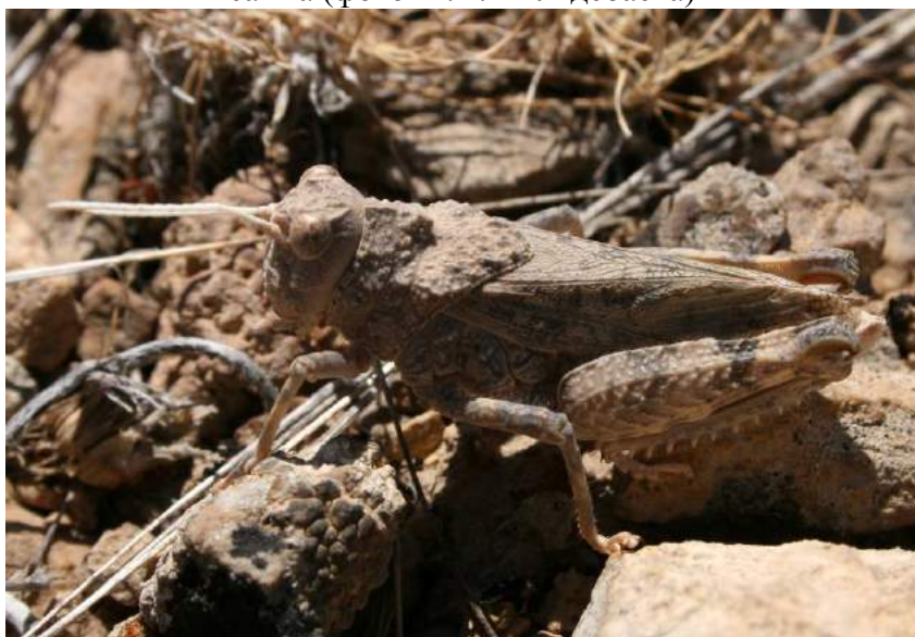
Pezotmethis karatavicus (Uvarov) - Пезотметис каратавский; самец