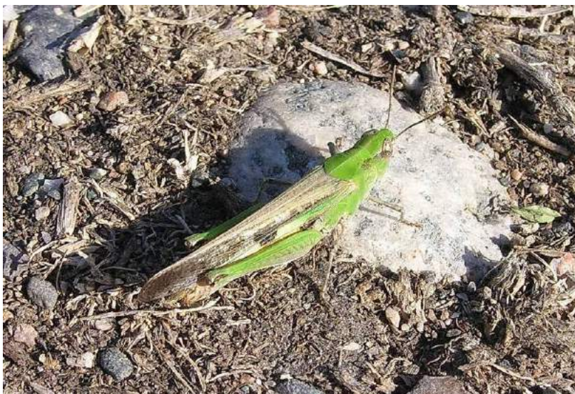
Epacromius tergestinus tergestinus (Charpentier) – Солончаковая летунья; самка

Epacromius tergestinus tergestinus (Charpentier) - Солончаковая летунья. Вид распространен в Казахстане (повсеместно, кроме лесостепной части), на юго-востоке европейской части России, юге Сибири (до Забайкалья), Северном Кавказе, в Азербайджане, Средней Азии, на юге Европы, в Афганистане, Северном и Западном Китае и Монголии. Держится на травах или на земле.