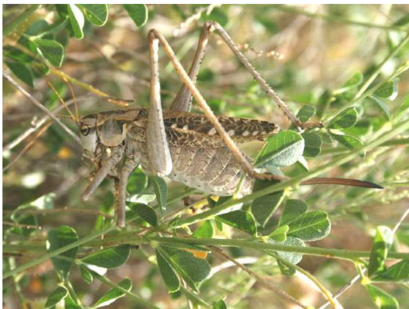
Caereocercus fuscipennis Uvarov