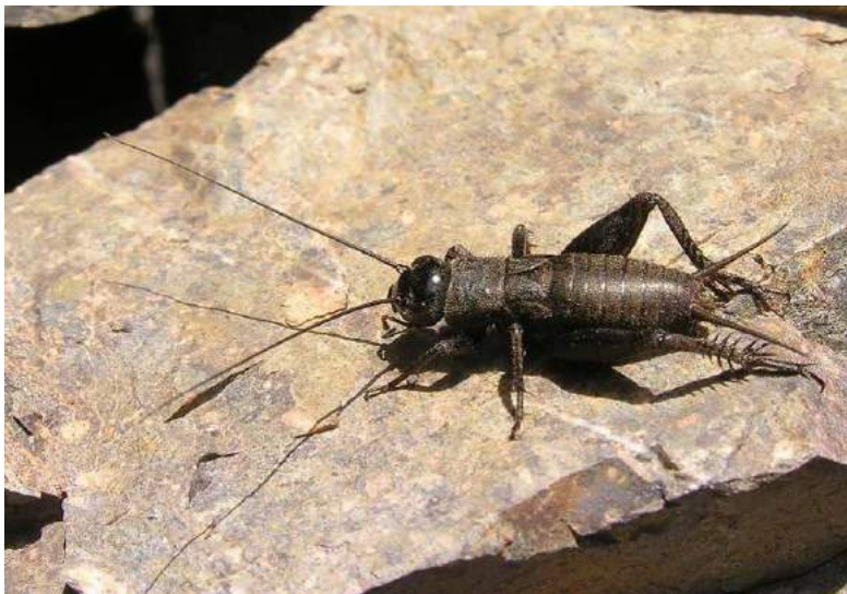
Melanogryllus desertus (Pallas) - степной сверчок; личинка

Gryllus bimaculatus De Geer – Сверчок двупятнистый. Степной западнопалеарктический вид. Распространен в Южной Европе, Африке, Закавказье, Передней Азии, Казахстане и Средней Азии. В Казахстане обитает на юге. Живет в норках в земле. Встречается в горах под камнями вдоль речек и ручьев. Иногда вредит сельскохозяйственным культурам.