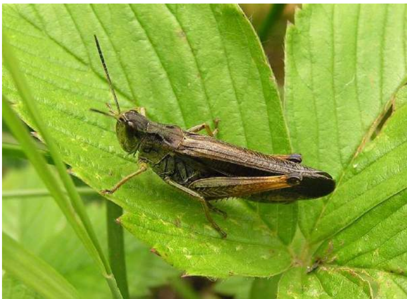
Sturoderus scalaris scalaris (Fischer-Waldheim) – Темнокрылая кобылка; самец

Sturoderus scalaris scalaris (Fischer-Waldheim) - Темнокрылая кобылка. Вид распространен в степной зоне Казахстана, горах Северного и Западного Тянь-Шаня, на Алтае, в центральных и южных районах европейской части России, Сибири, на Кавказе, в горах Средней Азии, в Западной Европе, Малой Азии, Монголии и Северном Китае. Кобылки держатся на растениях. Серьезный вредитель различных хлебных злаков и других культур. Вредит также лугам и сенокосным угодьям.