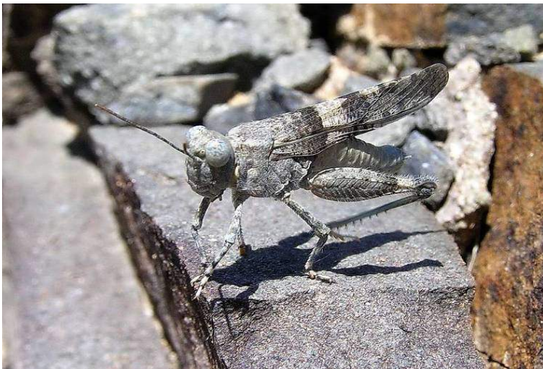
Sphingonotus nebulosus (Fischer-Waldheim) – Скальная пустынноца; самец; серая вариация