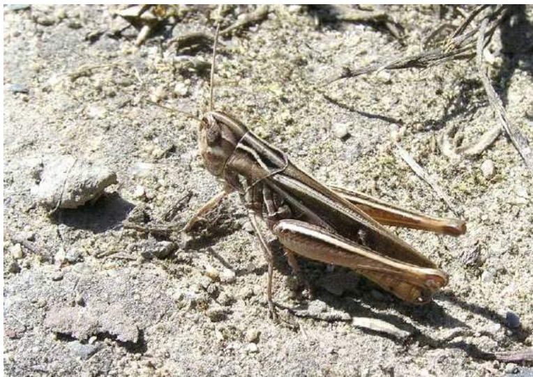
Stenobothrus (s. str.) lineatus lineatus (Panzer) – Толстоголовая, или полосатая травянка; самец