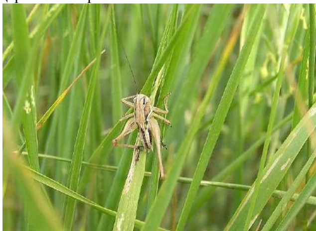
Tessellana vittata (Charpentier) – Скачок полосатый, личинка

Tessellana vittata (Charpentier) – Скачок полосатый. Южно-степной вид. Распространен в Западной Европе, на юге европейской части России, в Казахстане, Кыргызстане, на юге Сибири, Кавказе, в Таджикистане и Иране. В Казахстане встречается повсеместно, как на равнине, так и в горах. Держится на растениях.