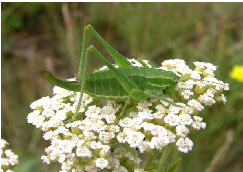
Poecilimon intermedius (Fieber) – Пилохвост восточный

Saga pedo (Pallas) – Дыбка степная. Степной европейско-казахстанский вид. Распространен в Северном, Центральном, Южном и Юго-Восточном Казахстане, степной зоне европейской части России. Обитает на луговых участках, в поймах рек и ручьев. Размножается партеногенетически, т.е. без участия самцов. Редок и заслуживает охраны. Численность и ареал сокращаются вследствие исчезновения природных местообитаний, прежде всего из-за тотальной распашки целинной степи. Дополнительное влияние на снижение численности вида оказывают интенсивный выпас скота и действие инсектицидов.