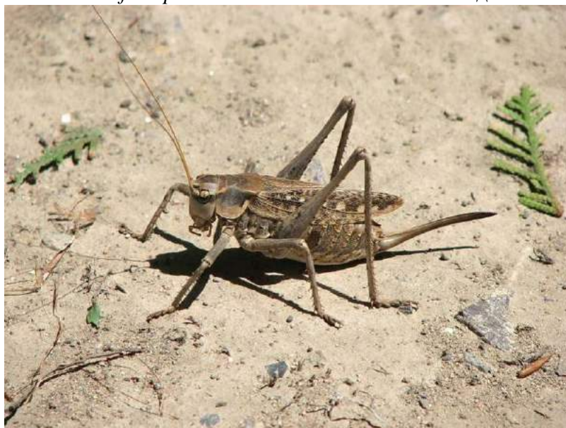
Caereocercus fuscipennis Uvarov – Кузнечик темнокрылый