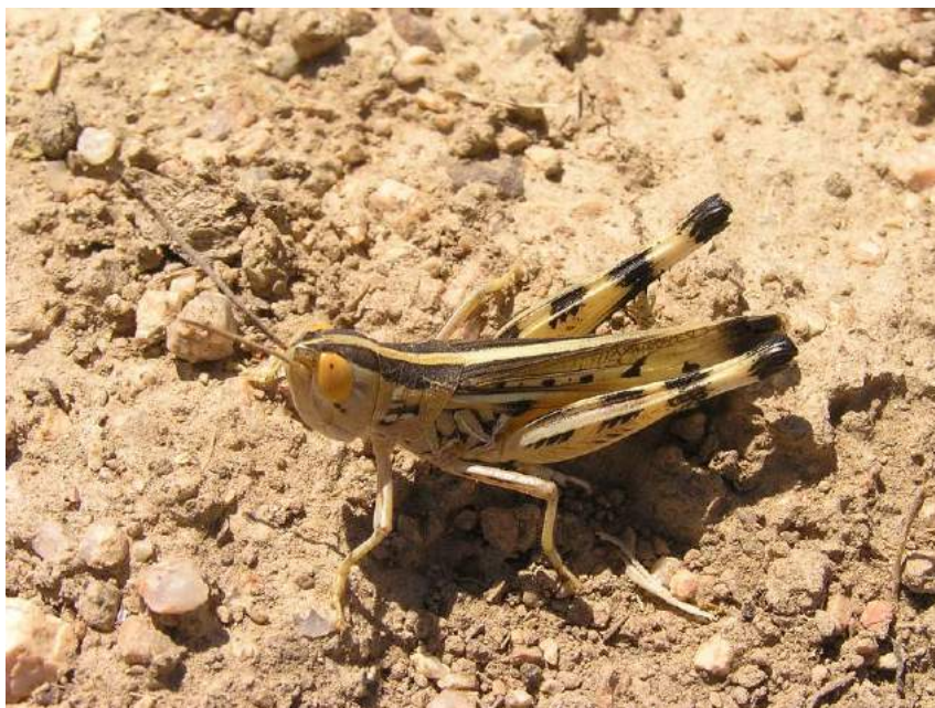
Ramburiella foveolata Serg. Tarbinsky – Точечная кобылка

Ramburiella foveolata Serg. Tarbinsky – Точечная кобылка. Пустынный ирано-туранский вид. В Казахстане обитает в пустынях и полупустынях Западного, Южного, Юго-Восточного, Центрального и Восточного Казахстана. В Центральном Казахстане, на юге Сары-Аркинской степи эта кобылка входит в число наиболее многочисленных видов саранчовых злаково-полынных ассоциаций.