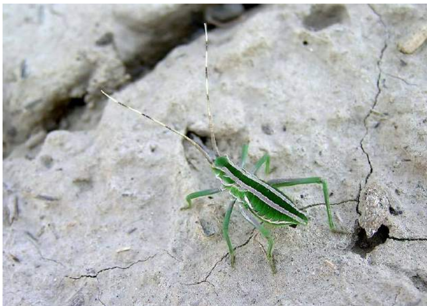
Glyphonothus thoracicus (Fischer-Waldheim) – Глифонотус торацикус; личинки