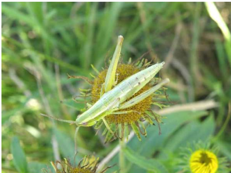
Euthystira brachyptera brachyptera (Ocskay) – Короткокрылый зеленчук; самка

Arcyptera fusca (Pallas) - Пестрая кобылка. Полизональный транспалеарктический вид. Встречается в Центральном (Акмолинская обл.), Северном (бывш. Кокчетавская обл.) и Восточном Казахстане (Восточно-Казахстанская обл.), на юге европейской части России, Северном Кавказе, юге Сибири до Якутии и р. Зeya, Закавказье, юге Европы, в Монголии. Иногда незначительно вредит хлебным злакам, кукурузе, картофелю, люцерне и другим с.-х. культурам. Кобылки живут на растениях.