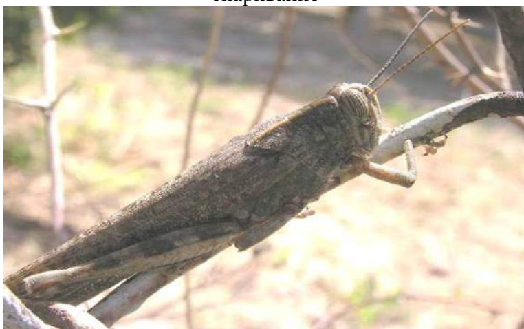
Anacridium aegyptium aegyptium (Linnaeus) – Египетская кобылка