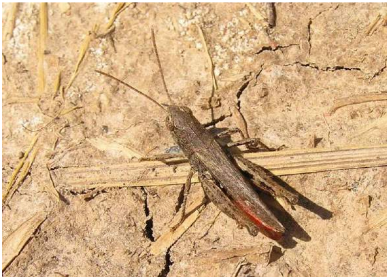
Omocestus haemorrhoidalis haemorrhoidalis (Charpentier) – Краснобрюхая травянка; самец