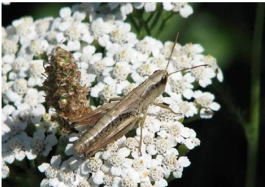
Chorthippus (s. str.) parallelus parallelus (Zetterstedt) – Короткокрылый конек; самка

– Короткокрылый конек. Степной вид. Распространен в Северном, Юго-Восточном и Восточном Казахстане, Кыргызстане, горах Узбекистана, в европейской части России (кроме крайнего севера), Сибири, Украине, Крыму, на Кавказе, в Западной Европе, Малой Азии и Монголии. Живет на разнотравно-злаковых лугах.