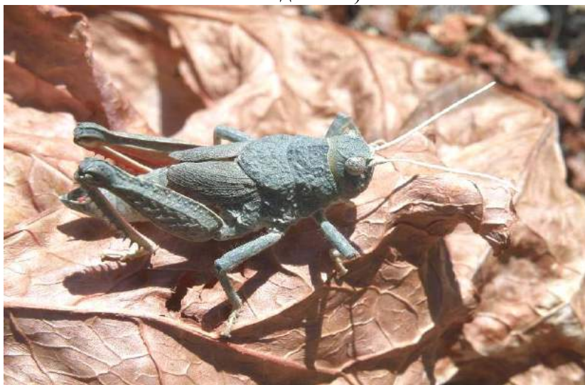
Pezotmethis nigrescens (Pulnov) - Пезотметис черноватый