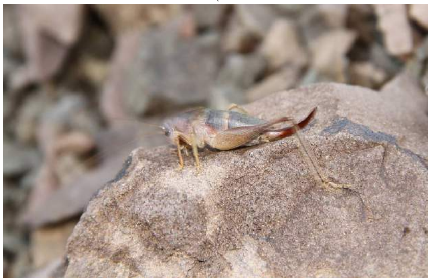
Eumetrioptera sp. Вид, возможно, новый для науки, найден в горах Шолак (южный отрог Джунгарского хр.)