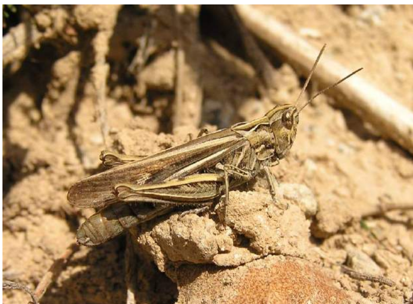
Chorthippus (Glyptobothrus) biguttulus biguttulus (Linnaeus) – Изменчивый конек; сверху самец, внизу самка