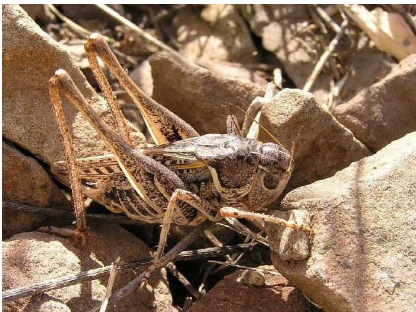
Decticus verrucivorus (Linnaeus) – Кузнечик обыкновенный, или серый