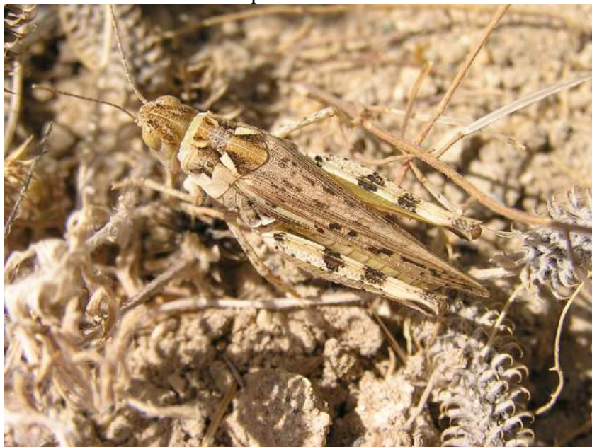
Dociostaurus ( Stauronotulus ) kraussi kraussi (Ingenitskii) – Атбасарка, или атбасарская крестовичка