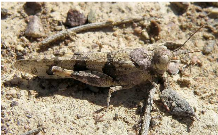
Sphingonotus maculatus Uvarov – Пятнистая пустынноца

Нижнем Поволжье, Северном Иране, Афганистане. Населяет главным образом глинистые пустыни, на северо-востоке ареала встречается также на песчано-каменистых речных наносах.