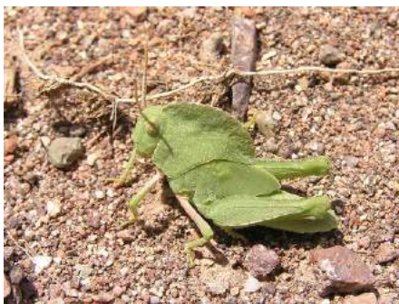
Pyrgodera armata Fisch.-Waldh. – Гребневка; личинка

Pyrgodera armata Fischer-Waldheim - Гребневка. Полупустынно-пустынный вид. Распространен в Казахстане (повсеместно, кроме лесостепной части), Предкавказье, Закавказье, Среднем и Нижнем Поволжье, на равнинах Средней Азии; по всей Передней Азии до Ирана и Афганистана. Второстепенный вредитель пастбищ.