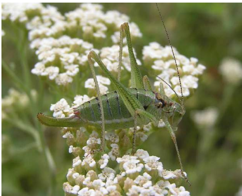
Poecilimon intermedius (Fieber) – Пилохвост восточный

Poecilimon intermedius (Fieber) – Пилохвост восточный. Северостепной европейско-среднесибирский вид. Обитает в Северном, Центральном, Восточном и Юго-Восточном Казахстане (Костанай, курорт Бурабай и далее на юг до центральной части Казахского мелкосопочника, горы Тарбагатай, Джунгарский Алатау, хр. Кетмень), за пределами Казахстана - в России (средняя полоса европейской части, Западная и Восточная Сибирь) и Кыргызстане (Бишкек, Каракол). Размножается партеногенетически. Самцы встречаются крайне редко. Экологически связан с разнотравно-степными участками, особенно близ лесных опушек, и держится здесь на различных растениях.