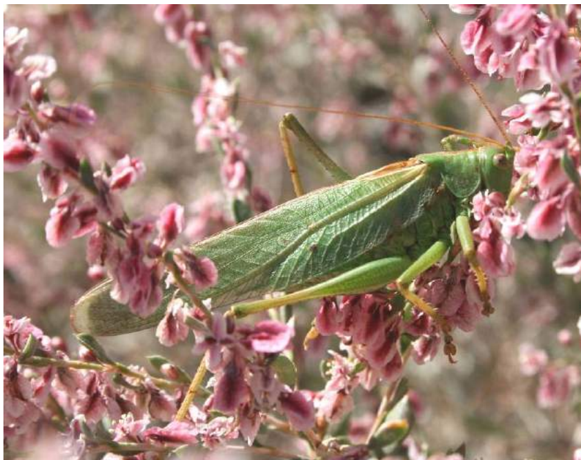
Tettigonia viridissima L. – Кузнечик зеленый; самец