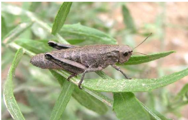
Conophyta semenovi semenovi Zubovsky – Конофима Семенова; самка; серая вариация