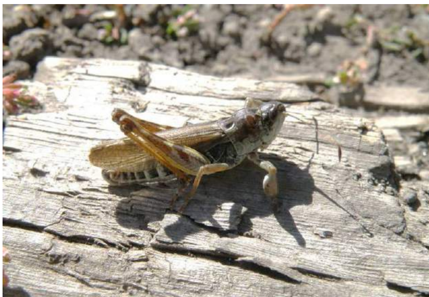
Gomphocerus sibiricus (Linnaeus) – Сибирская кобылка; самец

G. sibiricus turkestanicus (Mistshenko) - Сибирская туркестанская кобылка. Подвид распространен в горах Юго-Восточного Казахстана, Кыргызстана, Узбекистана, Таджикистана и в Западном Китае. Вредит пшенице, ячменю и высокогорным пастбищам.