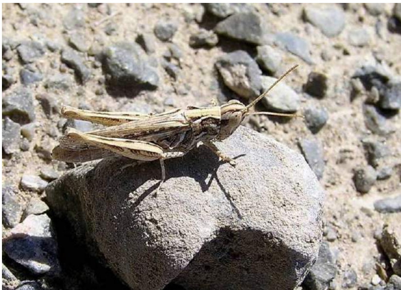
Eremippus simplex (Eversmann) – Обыкновенный пустынный; самка

Stenobothrus (s. str.) fischeri (Eversmann) - Травянка Фишера. Вид распространен в Казахстане, на юге европейской части России, в Сибири, горах Средней Азии, на Северном Кавказе, Западной Европе, Малой Азии и Монголии. Питается преимущественно дерновинными злаками.