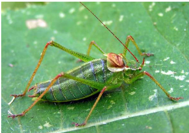
Isophya altaica Bey-Bienko – Изофия алтайская; самец

Isophya altaica Bey-Bienko – Изофия алтайская. Эндемик Алтае-Саянской горной системы. В Казахстане населяет горные районы Алтая. Характерной чертой экологии этого вида является его связь с богатыми, хорошо увлажненными разнотравными горными лугами с преобладанием в травостое двудольных растений. Биология не изучена.