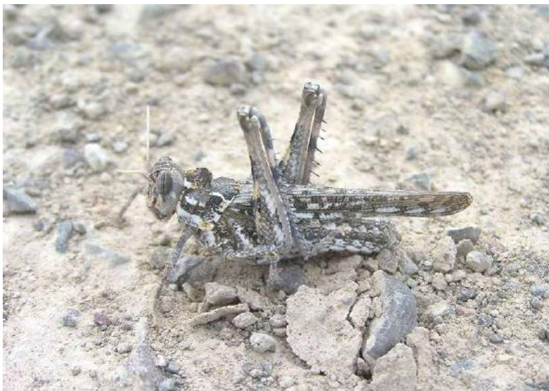
Dericorys tibialis (Pallas) – Пятнистая горбатка; самец.

держится на кустах солянок, анабазиса, парнолистника, белом саксауле. Личинки и взрослые питаются на указанных растениях. Повреждают белый, черный и зайсанский саксаулы.