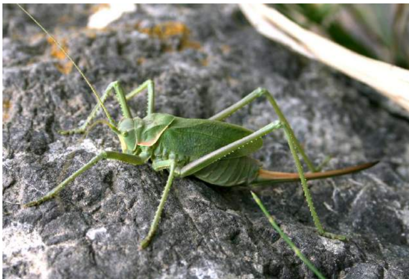
Glyphonothus alactaga Miram