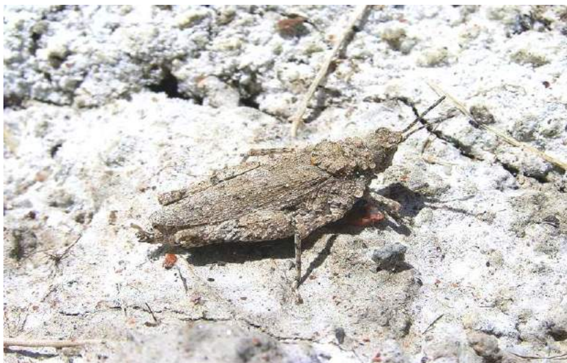
Chrotogonus turanicus Kuthy – Туранский хротогон; самка