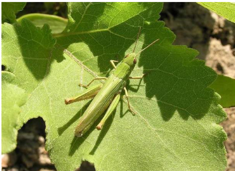
Chorthippus (s. str.) dichrous (Eversmann) – Южный конек

Chorthippus (s. str.) dichrous (Eversmann) – Южный конек. Южно-степной европейско-восточносибирский вид с оптимумом ареала в зоне полупустынь. Распространен в Южном и Юго-Восточном Казахстане, на юге европейской части России и в Западной Сибири, Алтае, Закавказье, Средней Азии; Монголии, Иране, Малой Азии. Живет на лугах.