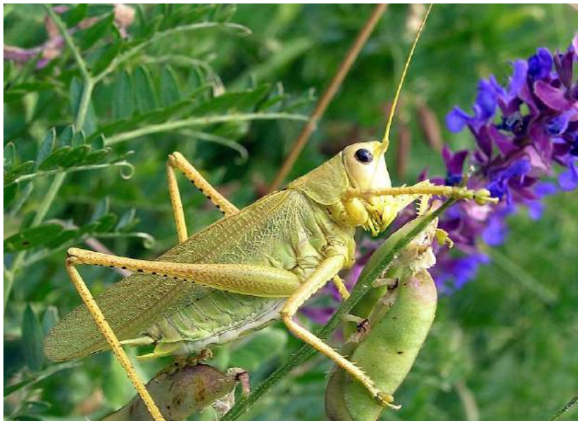
Tettigonia caudata (Charpentier) – Кузнечик хвостатый; самец

Tettigonia viridissima Linnaeus – Кузнечик зеленый. Северо-степной транспалеарктический вид. Казахстан: повсеместно. – Россия: средняя полоса и юг европейской части, юг Сибири, Хабаровский край, Приморье; Кавказ; Средняя Азия; Северная Африка; Западная Европа; Передняя Азия; Афганистан, Северная Индия; Монголия; п-ов Корея; Китай. Питание смешанное.