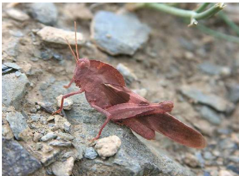
Pyrgodera armata Fischer-Waldheim – Гребневка; красная вариация