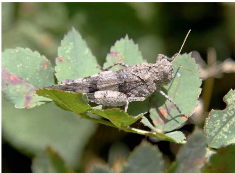
Oedipoda caerulescens caerulescens (Linnaeus) – Голубокрылая кобылка; самка

сенокосным угодьям. Основание крыльев голубое с черной перевязью.