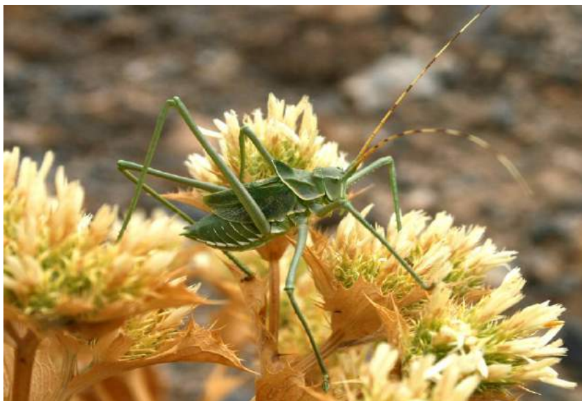
Glyphonothus coniciplicus Uvarov – Глифонотус кониципликус; вверху самка, внизу самец