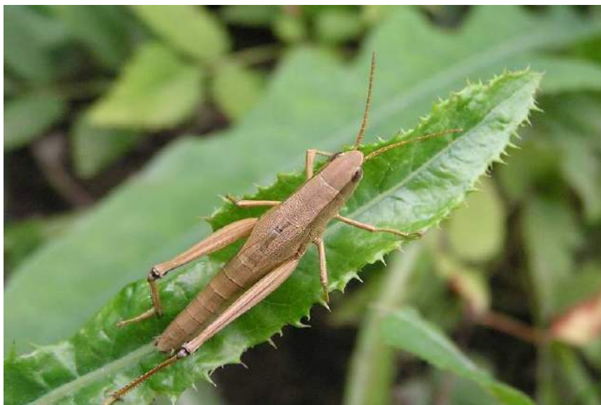
Chrysochraon dispar (Germar) – Непарный зеленчук; самка