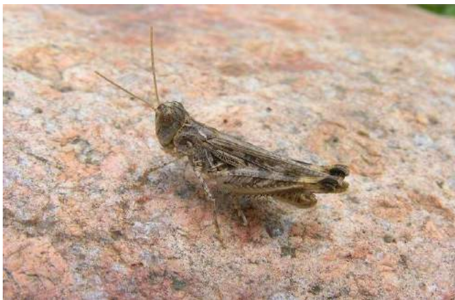
Notostaurus albicornis albicornis (Eversmann) – Пегая крестовичка; вверху самка, внизу самец