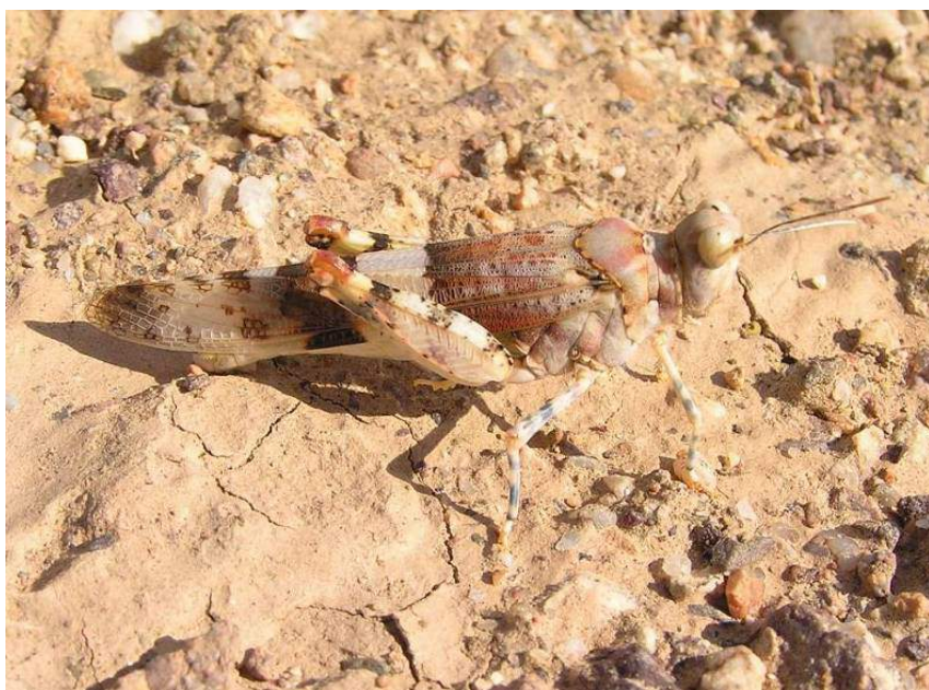
Pseudosphingonotus savignyi (Saussure) – Песчаная пустынноца на глинистом грунте

Pseudosphingonotus savignyi (Saussure) – Песчаная пустынноца. Пустынный среднеазиатский вид. Распространен в Западном и Юго-Восточном Казахстане, Средней Азии (кроме гор), Азербайджане, Грузии, Иране, Афганистане, Пакистане, Передней Азии, Северной Индии и Северной Африке. Предпочитает песчано-каменистые пустыни. Интересно, что окраска в определенной степени зависит от окраски субстрата. Достаточно редкий, узколокальный вид, заслуживающий охраны, тем более что для него в Казахстане никогда не отмечались вспышки размножения с нежелательными последствиями для сельского хозяйства.