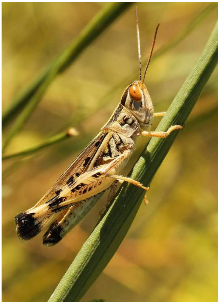
Ramburiella turcomana (Fischer-Waldheim) – Туркменская кобылка