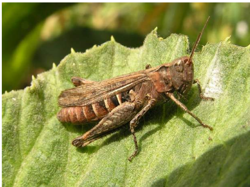
Chorthippus (G.) apricarius (Linnaeus) – Бурый конек;верху самец, внизу самка