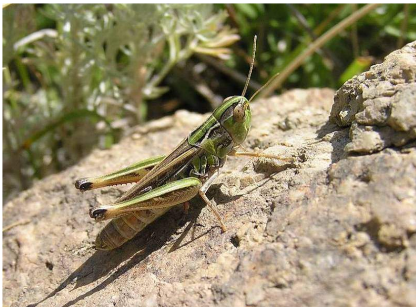
Stenobothrus (s. str.) fischeri (Eversmann) – Травянка Фишера

Stenobothrus (s. str.) lineatus lineatus (Panzer) – Толстоголовая, или полосатая травянка. Вид распространен в Северном, Северо-Западном Казахстане, европейской части России (кроме севера), юге Сибири, на Кавказе, юге Европы, в Северной Монголии. Питается различными злаками, на которых и живет.