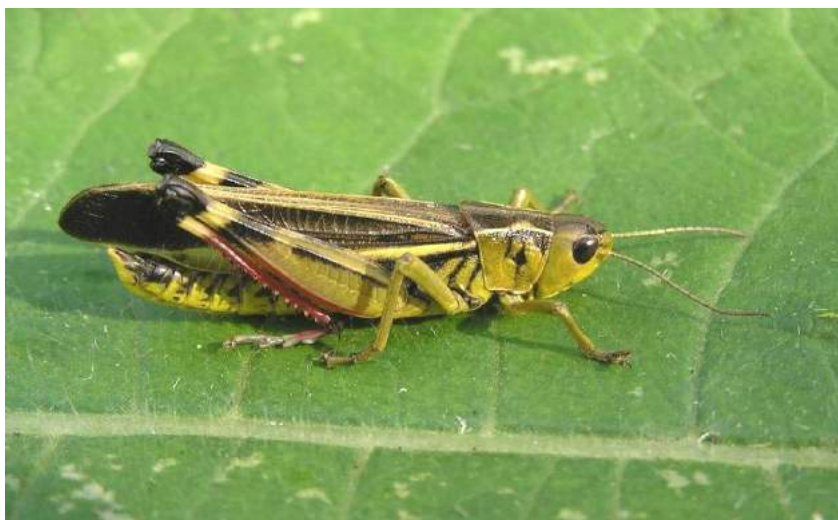
Arcyptera fusca (Pallas) – Пестрая кобылка; самец

Arcyptera microptera (Fischer-Waldheim). Транспалеарктический вид. Разделяется на 11 подвидов, 3 из которых встречаются в Казахстане. Наиболее обычный подвид – A. microptera microptera (Fischer-Waldheim) – Крестовая кобылка. Живет в Центральном, Северном, Северо-Восточном и Восточном Казахстане. Встречается также на юге европейской части России, Северном Кавказе, юге Сибири и Дальнего Востока, включая Шантарские о-ва, в Украине, Закавказье, Средней Азии (горы), на юге Европы, в Северном Иране, Северо-Западном, Северном и Северо-Восточном Китае, Северной Монголии. Серьезно вредит хлебным злакам, картофелю, табаку, хлопчатнику, лекарственным растениям, пастбищам и сенокосным угодьям почти по всей области своего распространения. Держится на растениях. Отличительными морфологическими признаками являются следующие: теменные ямки ясно вдавленные, гладкие, без точек; задние крылья бесцветные; Переднеспинка с сильно тупоугольно вогнутыми боковыми киями.