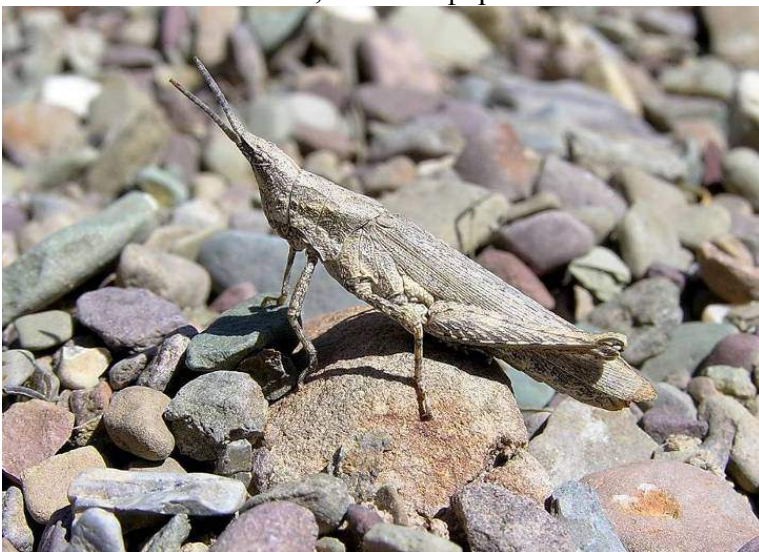
Pyrgomorpha bispinosa Walker – Пустынная остроголовка; самка, серая форма