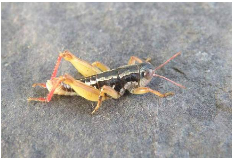
Conophyma sokolovi decorum Mistshenko – Конофима Соколова; самец