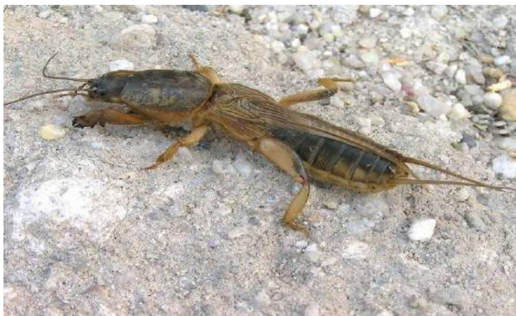
Grylotalpa unispina Sauss. – одношипная медведка

В Казахстане известно 2 вида (1 род). На юге наиболее обычна одношипная медведка – Grylotalpa unispina Sauss.