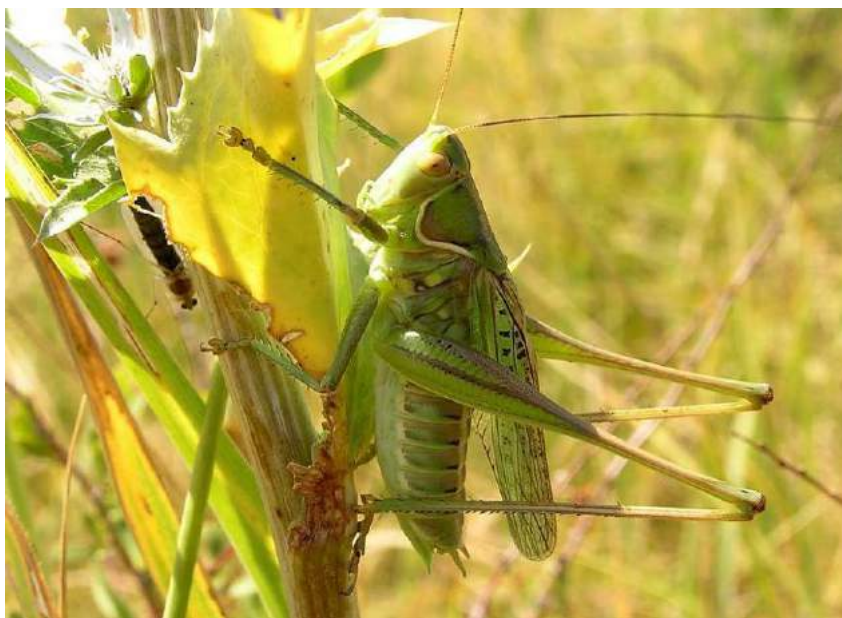
Gampsocleis glabra (Herbst) – Кузнечик оголенный; самец