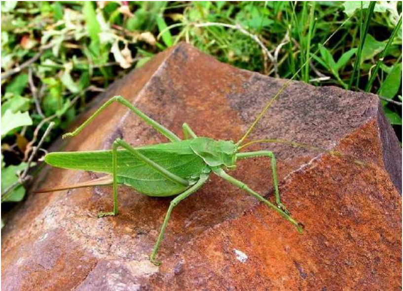
Glyphonothus thoracicus (Fischer-Waldheim) – Глифонотус торацикус; самки