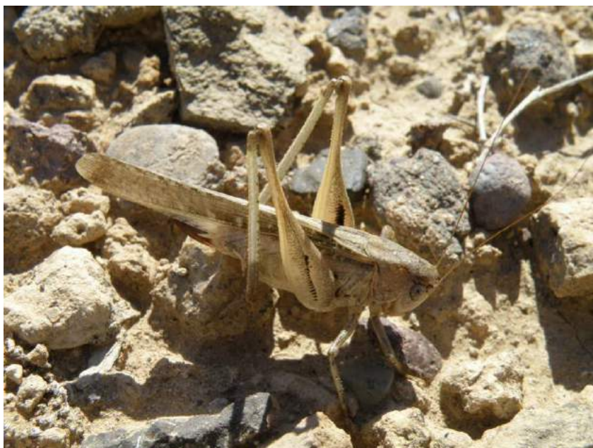
Platycleis intermedia intermedia (Audinet-Serville) – Скачок пятнистый; сверху самец, внизу самка