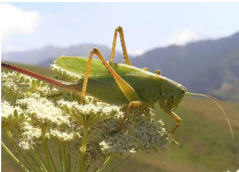
Tettigonia caudata (Charpentier) – Кузнечик хвостатый, самка