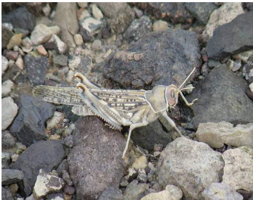
Dericorys albidula Audinet-Serville – Большая саксауловая горбатка; самец

Восточном Казахстане, Средней Азии (равнины), Афганистане, Западном Пакистане, Сирии, Ираке, Иране, Северной Африке. Типичный обитатель пустынных кустарниковых растений. Образ жизни кобылки связан с различными солянками, элленией, анабазисом, черным и белым саксаулом. В годы массового размножения сильно вредит саксаулам в Средней Азии, а иногда и посевам. Обычно держится на растениях.