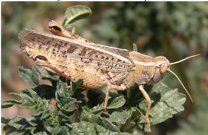
Calliptamus italicus (L.) – Итальянский прус; самка

Dericorys albidula Audinet-Serville - Большая саксауловая горбатка. Вид распространен в Южном и Юго-