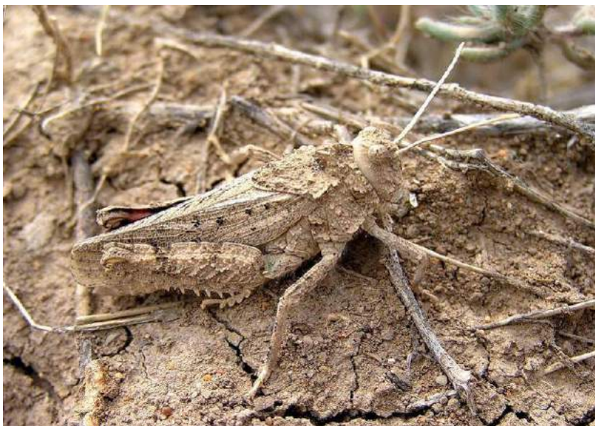
Asiotmethis muricatus (Pall.) - Степная кобылка

Shumakov обитает на севере Центрального Казахстана: от Астаны до Караганды и верхнего течения р. Сары-су.