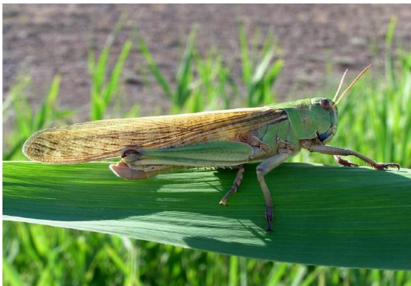
Locusta migratoria L. – Азиатская саранча; самец