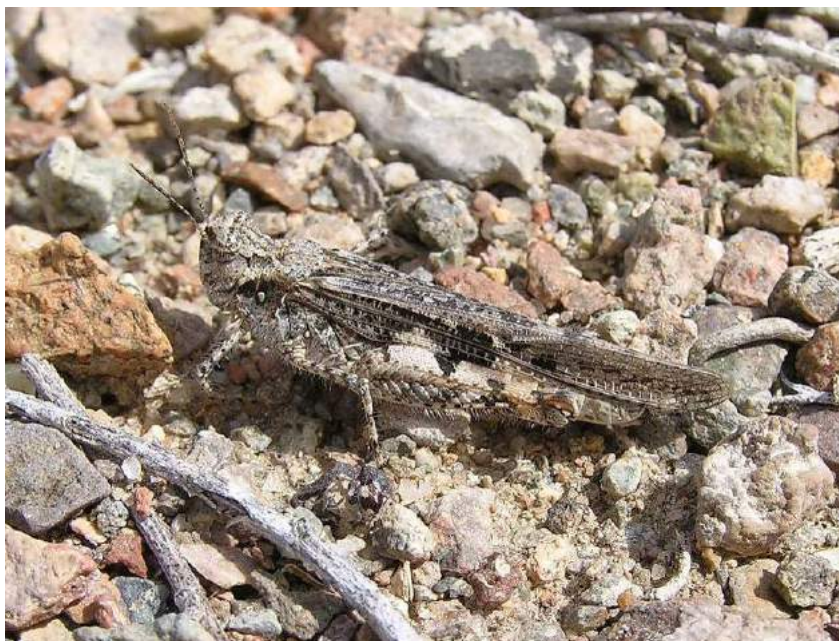
Acrotylus insubricus insubricus (Scopoli) – Зимняя кобылка

восточных каменистых склонах с наличием одиночных дерновинок миниатюрного ковылька.