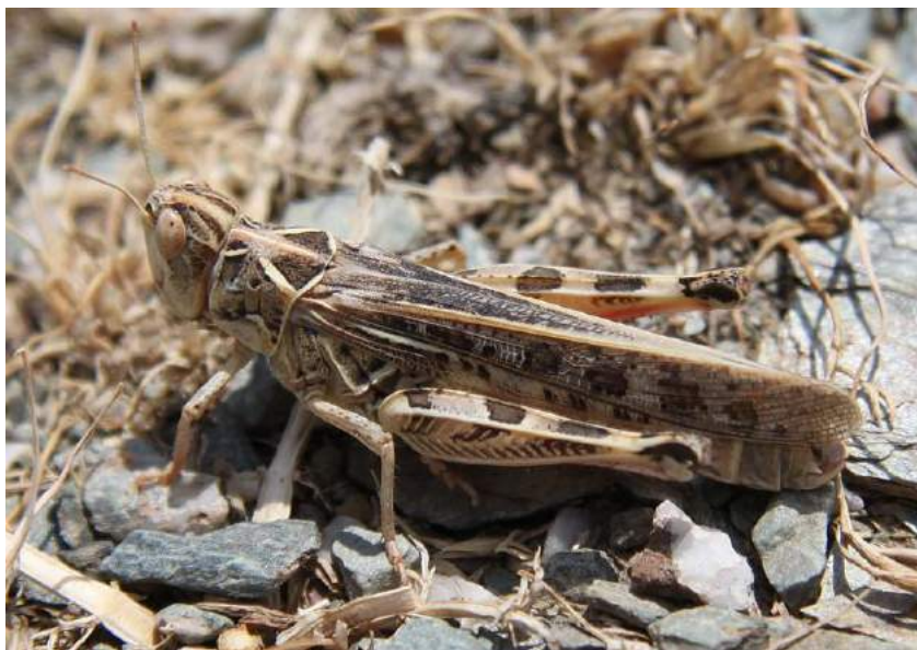
Dociopterus (s. str.) maroccanus (Thunberg) – Мароккская саранча

Dociopterus (s. str.) tartarus Stshelkanovtzev – Пустынная крестовичка. Полупустынно-пустынный европейско-среднеазиатско-казахстанский вид. В Казахстане обитает на западе, юге, юго-востоке и востоке. Незначительно вредит посевам хлопчатника в Средней Азии. Держится на растениях или на почве.