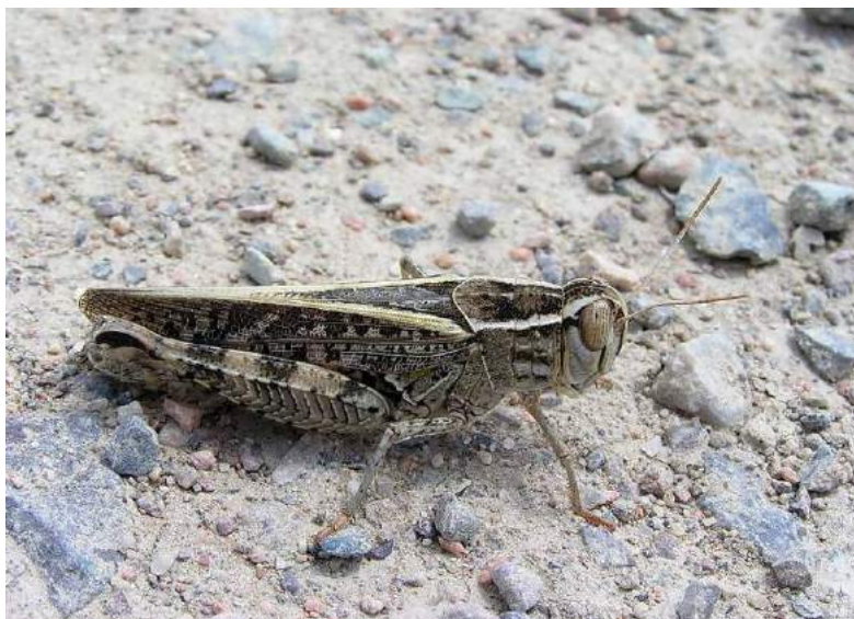
Calliptamus barbarus (Costa) – Пустынный прус; самка

Calliptamus barbarus (Costa) – Пустынный прус. Южный западнопалеарктический вид, проникающий в Пакистан и Индию. Разделяется на 3 подвида, 2 из которых живут в Казахстане. В Западном Казахстане обитает C. barbarus barbarus (Costa) – собственно пустынный прус. В Южном, Юго-Восточном, Западном, Центральном и Восточном Казахстане – C. barbarus cephalotes Fischer-Waldheim – Полубогарный прус. Обитает в пустынных ландшафтах, предгорьях, на пустырях, межах, по берегам оросительных каналов, обочинам дорог, окраинам сельскохозяйственных посевов, а также в тугайных лесах. Часто встречается вместе с итальянским прусом. В природе питается листьями верблюжьей колючки, различных видов лебеды, полыни и парнолистника. Иногда вредит различным бахчевым, огородным культурам, эфиносам, пастбищам, посевам пшеницы и люцерны.