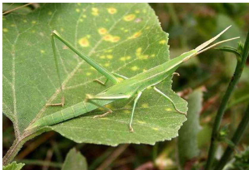
Acrida oxycephala (Pallas) – Пустынная акрида; вверху имаго, внизу личинка