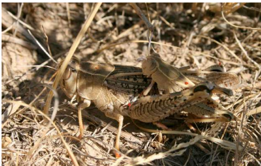
Calliptamus turanicus Serg. Tarbinsky – богарный, или туранский прус; спаривание

В Казахстане встречается в Южно-Казахстанской и Жамбылской областях. Незначительно вредит бахчевым, огородным и техническим культурам, а также сенокосным угодьям. Обладает сильно развитыми присосками лапок, что позволяет кобылке быстро и ловко передвигаться по вертикальным стволам и стеблям растений.