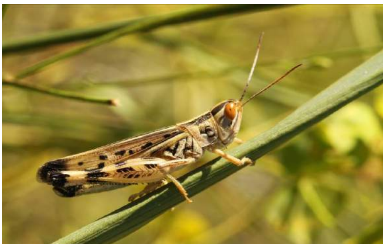
Ramburiella turcomana (Fischer-Waldheim) – Туркменская кобылка