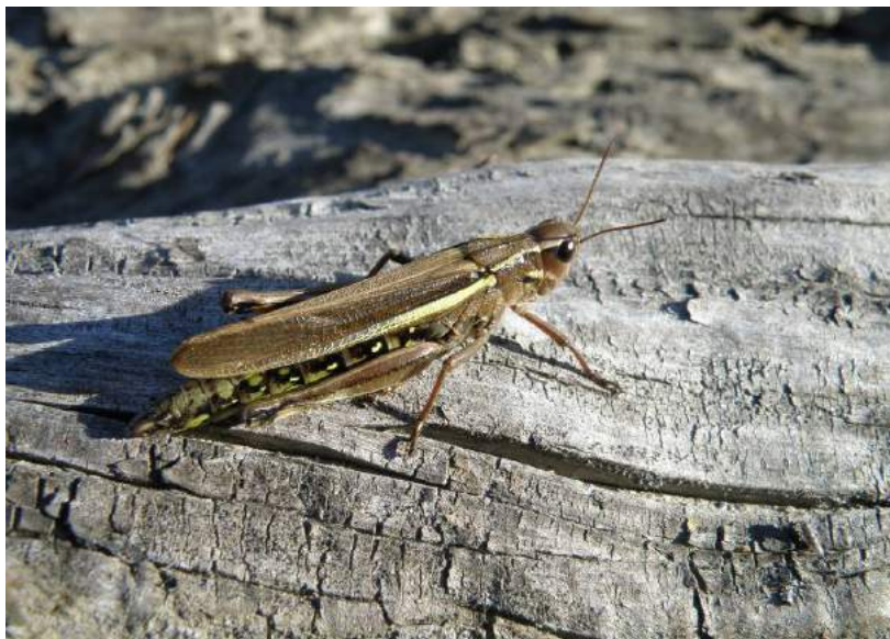
Stethophyma grossum (Linnaeus) – Большая болотная кобылка; самки