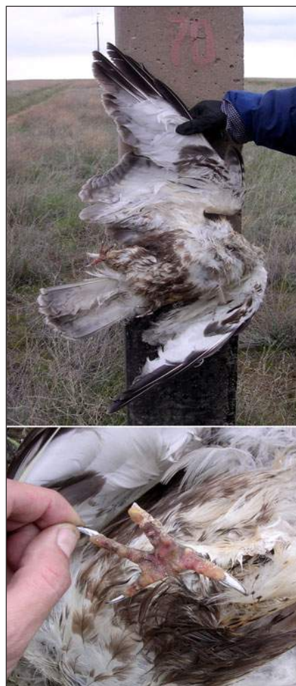
Зимняк ( Buteo lagopus ), погибший от поражения электротоком на ПО ЛЭП (верхнее фото) с характерными следами ожогов на лапах (нижнее фото).

10 km) about 58000 birds of prey are projected to be killed by electrocution every year only during spring migration (8 weeks). And the Steppe Eagles dominate absolutely – about 29000 individuals. 355500 individuals of electrocuted birds of prey are the species listed in the Red Data Book of Kazakhstan for murdering of which are punished by the legislation. However the state nature protection bodies do not undertake any efforts on punishment of owners of “power lines-killers”. We believe the target project on bird protection actions to retrofit existing electric poles-killers should be realized in Kazakhstan at the state level.