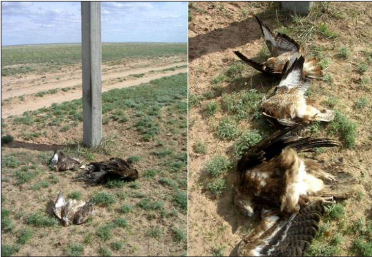
Степной орёл и два ка- нюка, погибшие от пора- жения электротоком в течение дня на одной опоре ПО ЛЭП.

Steppe Eagle and two buzzards, electrocuted on an electric pole during a day.